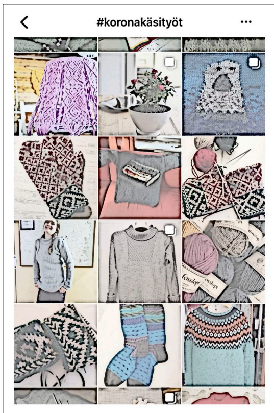
Kuva 2. Kuvakaappaus #koronakäsityöt-kuvavirrasta 7.2.—15.3.2021. Kuvavirtaotoksessa käsityön digitaalinen materiaalisuus rakentuu valmiista ja keskeneräisistä käsitöistä. Koko pandemian aikana eniten kuvattuna koronakäsityönä näyttäytyy villasukkien neulominen. Neulepuserot, ja erityisesti islantilaisneuleet, nousevat korostuvat kuva-aineistossa tarkastelujakson loppupuolella. Kuva muokattu.

Erityisesti neulominen (n=155) nousee koronakäsityöjulkaisuissa merkittävään rooliin. Läpi pandemian neulomista kuvataan ensisijaisesti valmiiden tuotteiden kautta, mutta toisinaan myös etenevinä taidon oppimisen projekteina (kuva 2).