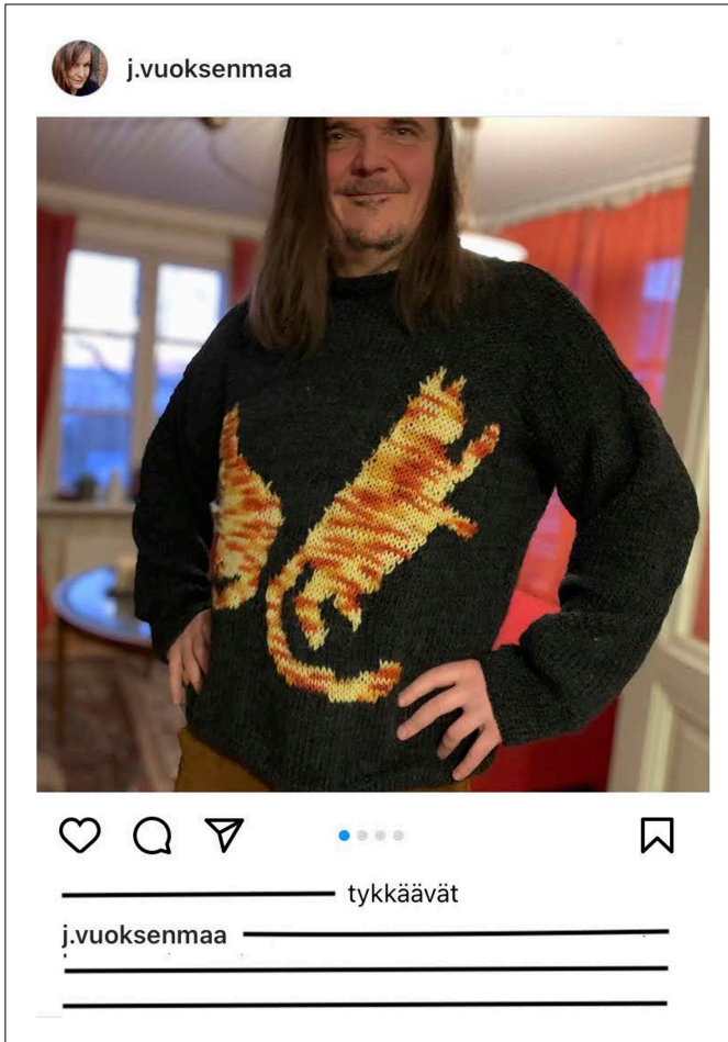
Kuva 4. Käsityö raami- tettuna kuvaan. Käsityöntekijän julkaisema kuvasarjaotos, jossa tekijä kuvaa toiselle henkilölle lahjaksi tekemäänsä #koronakäsityöt-villapuseroa valmiina käyttäjänsä päällä.

Toisinaan kuvavirroista voi tulkita, että käsityötuotteita kuvataan tekijöidensä päällä; tällöin käsityö ottaa roolin vuorovaikutteisessa suhteessa kuvan julkaiseeseen käsityöntekijään. Käsityötä kuvataan myös lahjana toiselle, kuten kuvassa 4, jossa koronakäsityönä syntynyt villapusero esitetään kotiympäristössä lahjan saaneen henkilön yllä. Tekijyys näyttäytyy tällöin viitteellisesti (ks. Zappavigna 2016): tekijä itse on mukana kuvan ottajana ja sen materiaalisuuden digitaalisena rekonstruoijana ja jakajana. Kuvassa 4 kohteena voi siis nähdä yhtä lailla koronakäsityönä syntyneen villapuseron kotiympäristössä poseeraavan henkilön yllä, kuin tekijyyden implisiittisen representaation (ks. Zappavigna 2016), joka materialisoituu lahjaksi annetun villapuseron kuvaamiseen ja edelleen kuvan jakamiseen tekijän omalla sosiaalisen median tilillä. Kuva toimii todisteena rakennetusta käsityötuotteen esittelytilanteesta, jossa ovat läsnä sekä käsityön materiaalisuus että tekijän näkökulma esittelyn intiimissä hetkessä. Koronakäsityökuvissa käsitöiden tekeminen ei kuitenkaan useinkaan näyttäydy spontaanina vuorovaikutuksena, vaan kuvaan tarkkaan ja tarkoituksellisesti rajattuna otteena arjen toiminnasta. Käsityötä muovataan tai sen kanssa