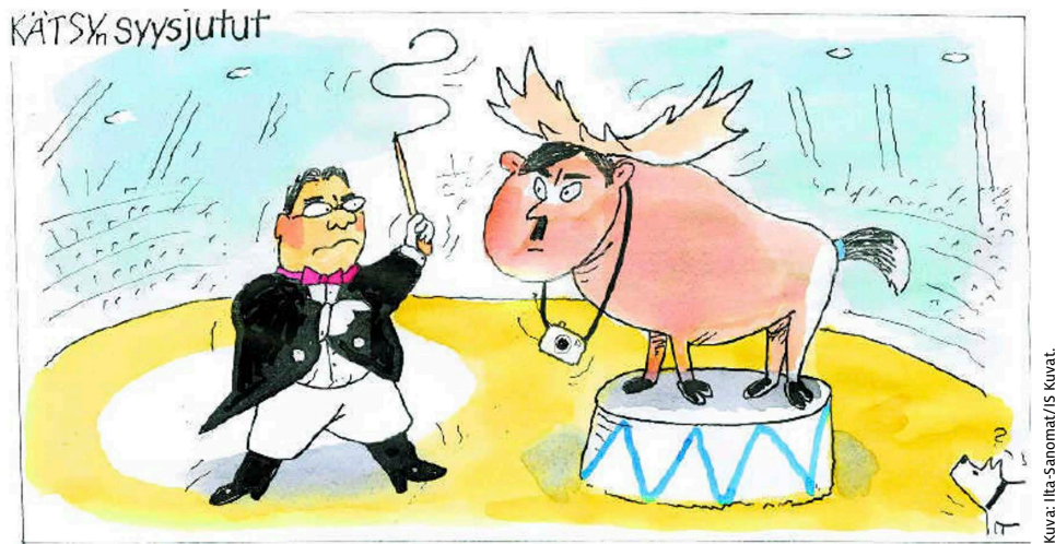
Kuva 4. Soini ja Hirvisaari, IS 5.10.2013