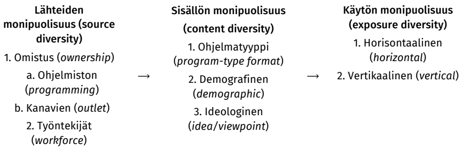
Kuvio 1. Moninaisuusketju Napolin (1999b) mukaan

puolisuuden ketjumallin ( diversity chain ) korvaamista kuusisaraisen tähden muotoisella hahmotuksella 3 . Ylikosken ja Ahvan (2024) esityksen taustalla on perusteltu kritiikki ketjumallin keskeistä lähtöoletusta kohtaan: että diversiteetin lisääntyminen yhdessä ketjun ”lenkissä” lisääisi sitä myös hierarkkisesti seuraavissa lenkeissä (Kuvio 1). Eihän suinkaan ole varmaa, että sanomalehtien omistuksen hajaantuminen (moninaisuuden kasvu lähteiden tasolla) johtaisi juttutyyppeiden lisääntymiseen (moninaisuuden kasvuun sisältöjen tasolla) ja sitä kautta monipuolisempien juttujen lukemiseen (moninaisuuden kasvuun käytön tasolla) (vrt. van der Wurff 2011).