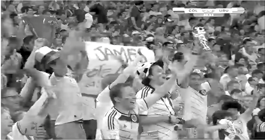
Kuva 1. Kolumbian fanijoukko juhlimassa Kolumbian toista maalia Uruguayta vastaan. (Kolumbia-Uruguay)

Kuvassa on nähtävissä ideaalifanin mallille tunnusomaisesti sekä lukematon määrä erilaista väriä tunnustavaa fanirekvisiittaa että kannattajien emotionaalinen ja sosiaalinen panostus joukkueeseensa. Ottelun selostaja kommentoi usein fanien ulkonäköä tai toimintaa silloin, kun kamera valitsee fanijoukon kuvaan. Toisaalta selostaja tulkitsee silloin tällöin fanien toimintaa myös kameran ulkopuolelta. Tällöin hän laajentaa yleisön näkökenttää ja tuottaa ideaalifanin mallia omista tulkinnoistaan. Huomioitavaa on, että kamera ei huomioi lainkaan ”väärinkannattajia”. Selostaja sen sijaan saattaa tehdä arvottavia huomioita ideaalifanin mallin vastaisesti käyttäytyvistä kannattajista, kuten alla olevasta esimerkistä on nähtävissä.