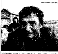
Yhdysvallat... Naton... Clintonin... Sivu C 1