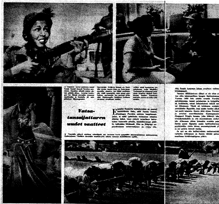
Kuva 4. Suomen Kuvalehti 29.9.1956.

Tässä suhteessa huomattavan tärkeä juttu koko tutkimukselle on ”Vatsatanssijattaren uudet vaatteet” -juttu (SK 29.9.1956). Siinä käytetään tunnettua orientalistista kuvastoa: naiskaunotar tanssii ylellisessä ympäristössä. Tämän tyyppiset myyttiset mielikuvat puuttuvat miltei tyystin myöhemmiltä tutkimusjaksoilta. Jut-