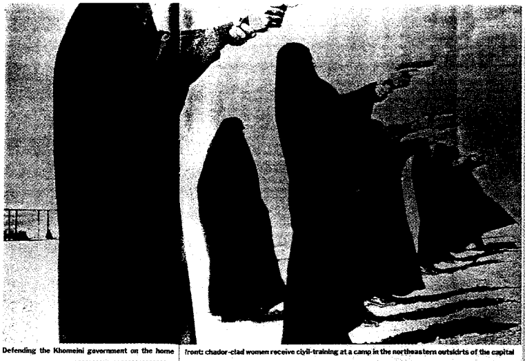
Defending the Khomeini government on the home front: chador-clad women receive rifle-training at a camp in the northeastern outskirts of the capital

Timen reportaasin "Living with war and revolution" (17.8.1987) kuvitus osoittaa, miten voimakkaasti naisen representaatio voidaan "ladata" edustamaan tiettyä suhtautumistapaa. Kuu-delle aukeamalle levittäytyvän, Iranista kertovan jutun teksti on varsin maltillinen ja sovitteleva. Iranista näytetään rauhallista arkea ja harhautta sisältäviä kuvia. Nämä tunnelmat on kuitenkin tiukasti alistettu jutun suurelle ja sotaisalle pääkuvalle, jossa naiset harjoittelevat ampumista –