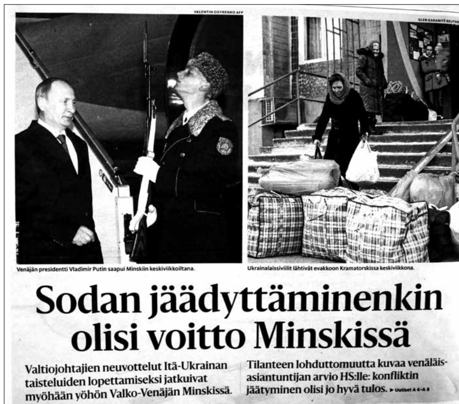
Kuva 5.