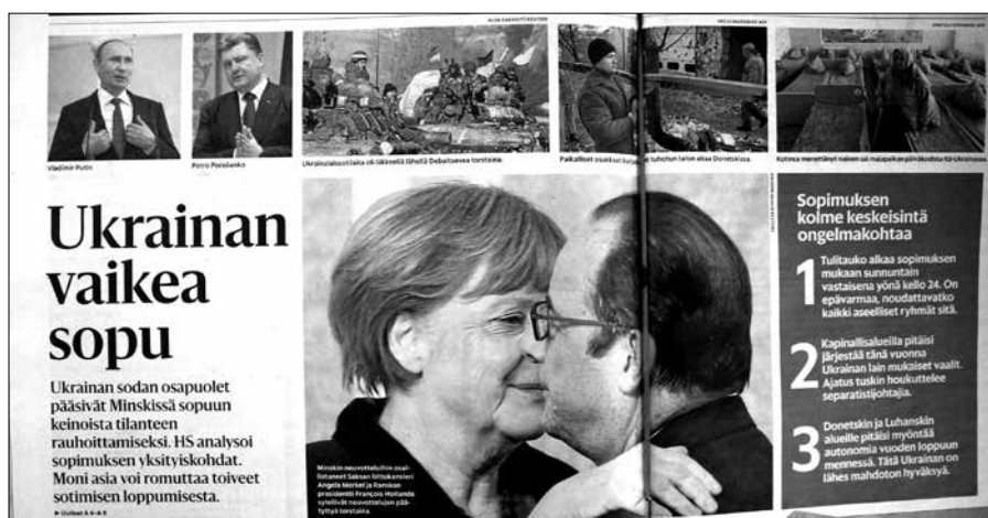
Kuva 8. Helsingin Sanomat 13.2.2015.

Minskin neuvottelujen päätyttyä vuorossa oli voittajan julistus. Ylen ja The Guardianin uutisointia lukuun ottamatta kaikki tutkitut julkaisut asemoivat Putinin neuvottelujen voittajaksi, mikä näkyi varsinkin printtilehtien kuvallisissa representatioissa. HS julkaisi neuvotteluja seuraavana päivänä (13.2.2015) pääuutissivullaan jutun otsikolla ”Ukrainan vaikea sopu” (kuva 8). Jutun teksti keskittyy saavutetun sovun haurauteen ja epävarmuuteen, ja Putinin voittaja-rooli rakennetaan kuvilla. Putinin olemus ja käsiensä asento viestii korostetusti itsevarmuudesta ja tyytyväisyydestä, kun taas Porošenkon kasvoilta heijastuu suru ja kädet ovat lähes anteeksipyytävässä asennossa. Samanlaiseen tulkintaan viittaa teksti sopimuksen ongelmakohtista, joista yhtä ”Ukrainan on lähes mahdoton hyväksyä”. Jutun päähuomio kohdistuu kuitenkin sen suurimpaan kuvaan, joka esittää Merkeliä ja Hollandea syleilemässä. Jutun kuvitus korostaa kahden suuren EU-maan johtajien lähentymistä jopa karikatyyrimäisesti. Otoksen valotushetki ja kuvakulma ovat osuneet niin, että Merkel ja Hollande näyttävät suutelevan. Kontekstissaan kuvan viesti on hämmäntävä: vaikea konflikti koettelee ukrainalaisia, mutta kaksi EU-johtajaa näyttävät sen ansiosta löytäneen toisensa. Pääkuvan yläpuolelle on sijoitettu pieniä kuvia Ukrainan armeijan sotilaista ja sodan varjossa elävistä siviileistä, joita käytetään jälleen poliittisen vastuun tuottamisessa.