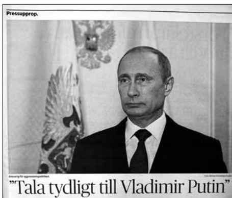
Kuva 3. Dagens Nyheter 27.7.2014.