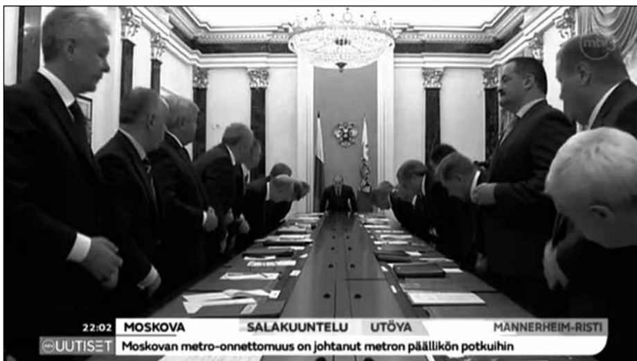
Kuva 2.