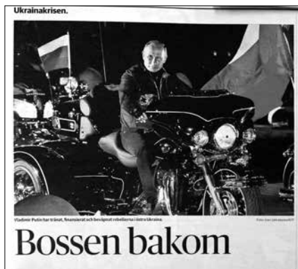
Kuva 4. Dagens Nyheter 24.7.2014.