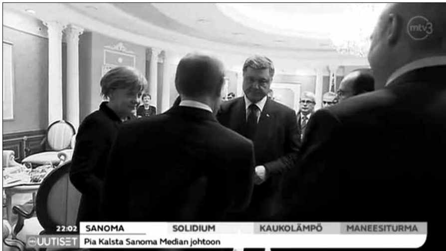
Kuva 7. MTV3 11.2.2015.

MTV3:n (11.2.2015) uutistoimitus kompensoi tätä seikkaa toiston, leikkausten ja sanallisen ohjailun keinoin ja korostaa HS:n tavoin ”arkkivihollisten” vastakkaisuutta. Uutisen kuvamateriaali on sama kuin Ylen jutussa, mutta uutisen alussa Porošenkon ja Putinin kättelylle raivataan tilaa leikkaamalla pois Putinin tervehdykset Hollannin ja Merkelin kanssa. Lyhyen studiojuonnon jälkeen katsojalle näytetään tuhokuvia Itä-Ukrainasta ennen neuvotteluihin siirtymistä. Näin MTV3, jälleen HS:n tavoin, käytti sodan hävityksen näyttämistä poliitikkojen vastuuttamisen keinona. Seuraavaksi Venäjä ja Ukraina esitetään konfliktin osapuolina sekä Putinin että Porošenkon esittäessä vuorollaan tulkintansa sodan syistä. Tämän jälkeen Putinin ja Porošenkon kohtaaminen näytetään uudestaan (kuva 7). Osapuolten vastakkainasettelu huipentuu toi-