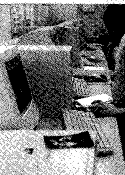
Internetin käyttö on lisääntynyt voimakkaasti, ja se on tullut osaksi jokaisen elämää. Koululaisetkin käyttävät Internetiä, ja heidän käyttäytymisensä on muuttunut. He eivät enää pelkää konetta, vaan tuijottavat sitä.

Haukiäläisten kasiluokkalaiset eivät silti innostu nettirajoituksesta Ilkka Toli Internetin käyttö on lisääntynyt voimakkaasti, ja se on tullut osaksi jokaisen elämää. Koululaisetkin käyttävät Internetiä, ja heidän käyttäytymisensä on muuttunut. He eivät enää pelkää konetta, vaan tuijottavat sitä. Tämä on ongelma, jota koulut eivät voi ohittaa. Koululaiset eivät enää pelkää konetta, vaan tuijottavat sitä. Tämä on ongelma, jota koulut eivät voi ohittaa. He eivät enää pelkää konetta, vaan tuijottavat sitä. Tämä on ongelma, jota koulut eivät voi ohittaa.