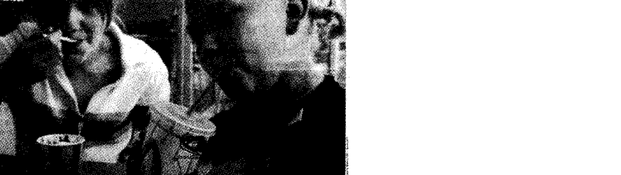
Ekonomistien mielestä Sharonin väkivalta vähentää maan taloudessa... Israelin... talouden... väkivalta... rapauttaa... Israelin... talouden...