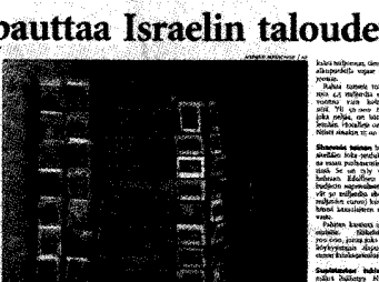
Ekonomistien mielestä Sharonin väkivalta vähentää maan taloudessa... Israelin... talouden... väkivalta... rapauttaa... Israelin... talouden...