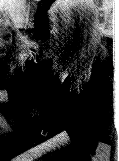
Internetin käyttö on lisääntynyt voimakkaasti, ja se on tullut osaksi jokaisen elämää. Koululaisetkin käyttävät Internetiä, ja heidän käyttäytymisensä on muuttunut. He eivät enää pelkää konetta, vaan tuijottavat sitä.