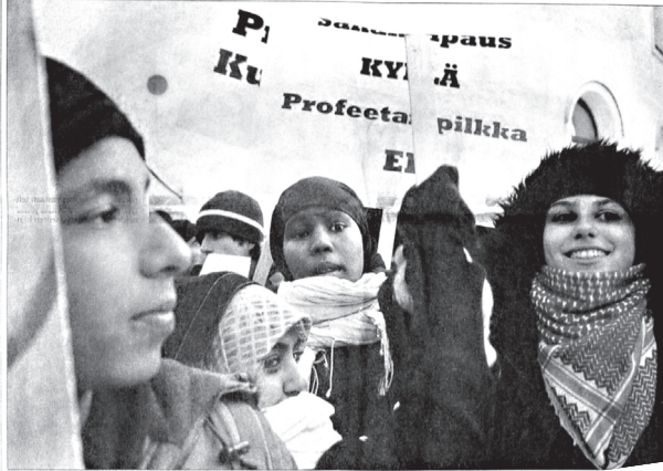
Arviolta pari sataa Muhammad-pilakuvia vastustavaa mielenosoittajaa kerääntyi tiistai-ilta Tanskan suurlähetystön liepeille Helsingin keskustassa. Mielenosoitus päättyi alkuaan puoleen tuntaa aiemmin alkutalouden jälellä, koska kova