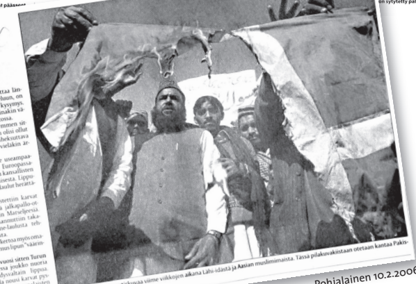
Tämä on ollut tuftua uutisissa viime viikkoon aikana Lähi-idässä ja Aasian muslimimaissa. Tästä pilakuvastaan uutetaan kantaa Paki-

VAASA Juoni Pohjalainen jooni.pohjalainen@pohjalainen.fi Islamilaisissa maissa on haluttu viime viikkoon mielenosoitusta Tanskan ja Neijan lippuja polttamaan. Useimmissa uutisissa on kuitenkin väitetty, että vain muutama kymmeniä ihmistä on ollut mukana. Tämä on kuitenkin totta. Mielenosoitusten järjestäminen on ollut helppoa, mutta niiden vaikutus on ollut suuri. Mielenosoitusten tarkoituksena on ollut saada maailmanlaajuisesti huomioon Tanskan ja Neijan lippujen polttaminen. Tämä on ollut helppo tapa satuttaa Tanskan ja Neijan lippuja. Mielenosoitusten tarkoituksena on ollut saada maailmanlaajuisesti huomioon Tanskan ja Neijan lippujen polttaminen. Tämä on ollut helppo tapa satuttaa Tanskan ja Neijan lippuja.