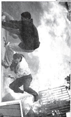
on syytetty palamaan esimerkiksi