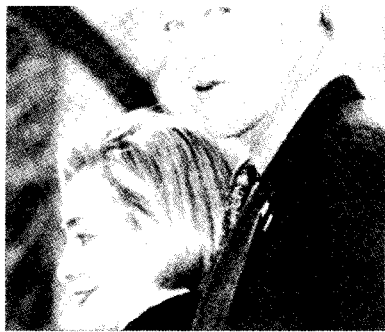
Hillary ja Bill Clinton saivat vaimonsa Billin seurustelun.

... ja nyt, jolloin onnistunut seksi-uhra. Vaikossaan on poliittisissa oloissa erittäin tärkeä Clintonin yhä voimakkain mainonta.