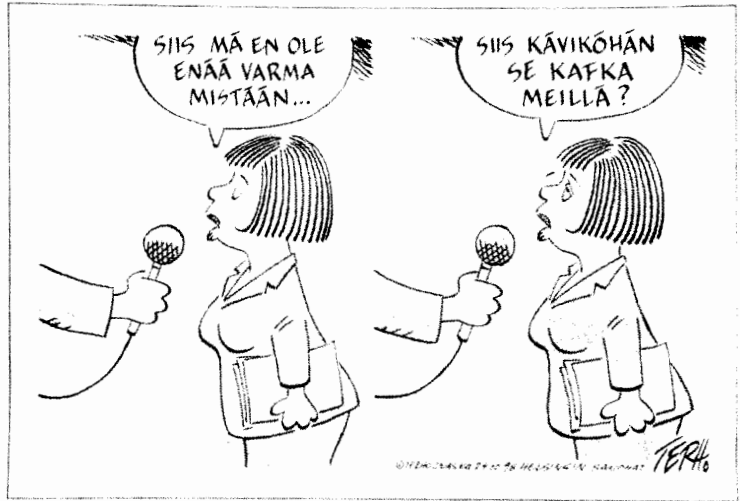
KUVA 4

kittämään yleistä (metaforista) käsitystä politiikasta teatterina, jota esitetään katsomossa istuvalle kansalle. Pilapiirroksissa hehkutellaan kyllä politiikan pelin likaisuudella ja erityisesti hallituksen ja opposition välisellä kiistalla, mutta heti kun tilanne kääntyy median ja poliitikkojen välisten julkisuuskäytäntöjen pohdintaan, asiasta ei enää revitä piirroksissa huumoria. Pohdittavaksi jää, miksi kiistaa käsiteltiin vain ja ainoastaan poliittisena pelinä ja näytelmänä, jota kansa seuraa passiivisena sivusta.