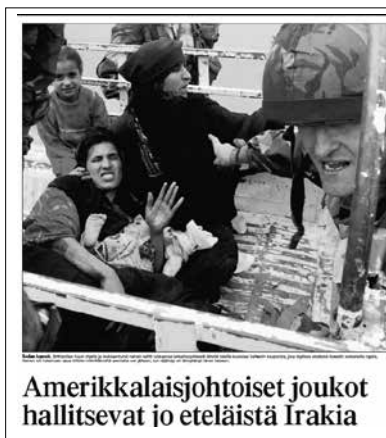
Kuva 1. Sodan kasvot (AL 23.3.2003).

Länsimaisen sotilaan rooli avustajana ja hyväntekijänä on aineistossa vahva. Esimerkiksi 3.4.2003 julkaistussa Aamulehden kuvassa brittisotilas nauraa ja pilailee lasten ympäröimänä. Kuvan yhteyteen on kuitenkin liitetty kuvateksti, joka kertoo liittouman hymykampanjasta ja liittouman toiveesta saada vastaavia kuvia enemmän julkaistuksi. Näin lehti peräänkuuluttaa huomautuksellaan kriittistä suhtautumista kuvien tunnelmaan.