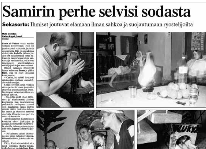
Kuva 5. Sodasta selviytynyt perhe (AL 16.4.2003).

Kuvasarja on aineiston ainoata kuvamateriaalia, joka menee sisälle irakilaisperheen kotiin ilman länsimaisten sotilaiden läsnäoloa. Aineistossa on myös sellaisia kuvia, joissa länsimaiset sotilaat ovat kotiovella, tekemässä tarkastusta paikallisiin taloihin tai pidättämässä ihmisiä kotoaan (AL 5.4.2003, AL 9.4.2003). Irakilaiskoteja käsittelevät kuvat ovat harvinaisuudessaan merkittävä lisä sodan uutisointiin ja arki-