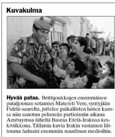
Kuva 2. Lasten ympäröimä brittisotilas (AL 3.4.2003).

Irakin aineistossa sotilas ja lapsi -kuvaustapa on ohjannut todennäköisesti se, että toimittajat ja kuvaajat kulkivat sotatanttereilla amerikkalais sotilaiden mukana. Irakin sodassa liittouman armeija otti käyttöön toimittajien ”suluttamisen” tai soluttautumisen sotajoukkoihin. Tämä herättää kysymään, kenen näkökulmasta asioita katsellaan. Soluttautuminen ei ollut täysin uutta, vaan muun muassa Falklandin sodassa 1982 kokeiltiin vastaavaa käytäntöä (Nohrstedt 2009). Kokemukset osoittivat, että kirjeenvaihtajat, jotka jakavat sotilaiden kanssa päivittäiset koettelemukset