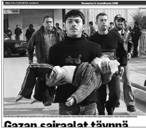
Kuva 6. Mies kantamassa haavoittunutta lasta (AL 5.1.2009). Kuva on selkeä tyypiesimerkki kuolleiden tai haavoittuneiden lasten kuvista, jotka lisääntyivät Gazan konfliktin kuvastossa.

On selvää, että myös näissä kuvissa näkökulma on vahvasti toisen osapuolen. Vai kuttaako tämä siihen, että lapsia on kuvissa paljon ja varsinkin haavoittuneita ja kuolleita lapsia? Onko palestiinalaiskuvaajien intressissä ollut vedota kansainväliseen mielipiteeseen lasten kautta? Toisaalta ei ole syytä epäillä, etteivätkö länsimaiset kuvaajat olisi myös kuvanneet pommitusten kohteena olevia lapsia – olihan Gazan kriisissä poikkeuksellisen paljon uhreina juuri lapsia. Gazan alueella asui pommitusten alettua 1,5 miljoonaa ihmistä. Sotaa käytiin suljetulla alueella, josta siviileillä ei ollut juurikaan mahdollisuutta paeta. Aluetta tulitettiin, käytännössä siviilikohteisiin, maalta, mereltä ja ilmasta. Myös lapset olivat pommitusten kohteina kaiken aikaa. Siviilejä arvioidaan kuolleen noin 700, heistä lapsia 460 (HS 26.1.2009). Haavoittuneita lapsia oli 1855. On selvää, ettei tällaista lapsiuhrin määrää voi uutisoinnissa sivuuttaa.