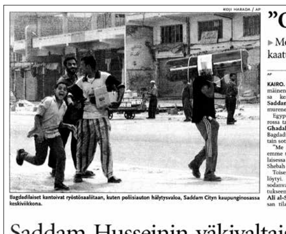
Kuva 4. Iloiset ryöstelijät (HS 10.4.2003)

Myös kuviin liittyvissä uutisteksteissä, niin Helsingin Sanomien kuin Aamulehdenkin, käsitellään ryöstelyä, jonka kuvataan riistäytyneen valloilleen. Kaikki mahdollinen kelpaa. Keskoskaapit, sydänmonitorit ja jopa EU-lippukin on anastettu parem-