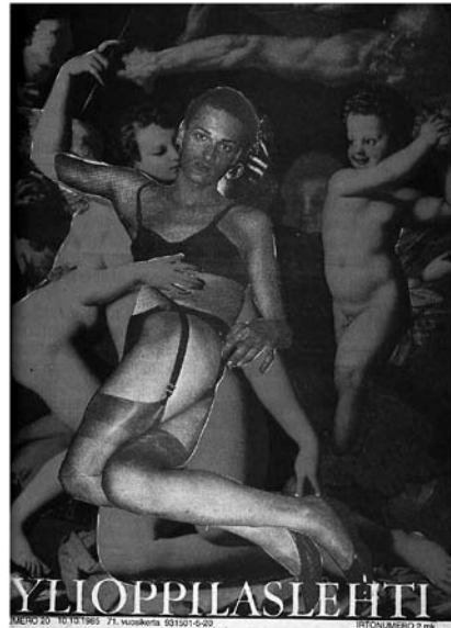
Ylioppilaslehti oli 1980-luvun lopulla postmoderneimmillaan. Tämä ilmeni niin sisällössä kuin lehden taitossa, joka viltteimpinä aikoinaan teki lehdestä välillä hankalasti luettavan.