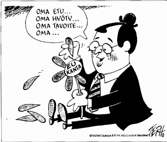
Piirros 1: Aktiivisuuden paradoksi: poliitikon 'stereotyyppi'. (HS 8.10.1994)

Politiikka näyttäytyy metaforissa usein poliitikkojen likaisena pelinä. Piirroksessa yksi Väyrynen toimii koko poliittisen kulttuurin metaforana joskin kuvan voidaan tulkita kuvaavan myös Väyrystä henkilönä tai vaikkapa Keskustaa puolueena. Joka tapauksessa politiikka nähdään piirroksessa lapsekkaana oman edun tavoitteluna.