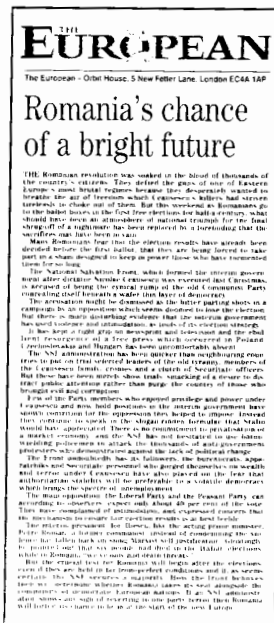
Maaliskuun 11. päivänä tänä vuonna ensimmäisen numeronsa julkaisut The European on tyografisesti näyttävä lehti, mutta pääkirjoituksen ulkoasu on perinteinen. Lehden logo kuitenkin painetaan sinisellä värillä.