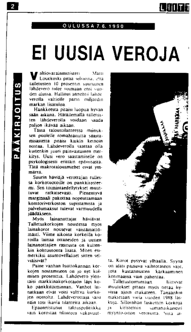
Oulussa ilmestynvä keskustalainen Liitto käyttää pääkirjoitussivullaan suomalaisittain vahvoja typografisia tehosteita. Pääkirjoitusten kuvitus on useimmiten symbolista.

Kirjoittajan näkemyksiä tulkitaan kieltoilmauksin, kuten ei näytä olevan, ei sinänsä ole mahdollista , ja vastakohtapartikkelein, joita