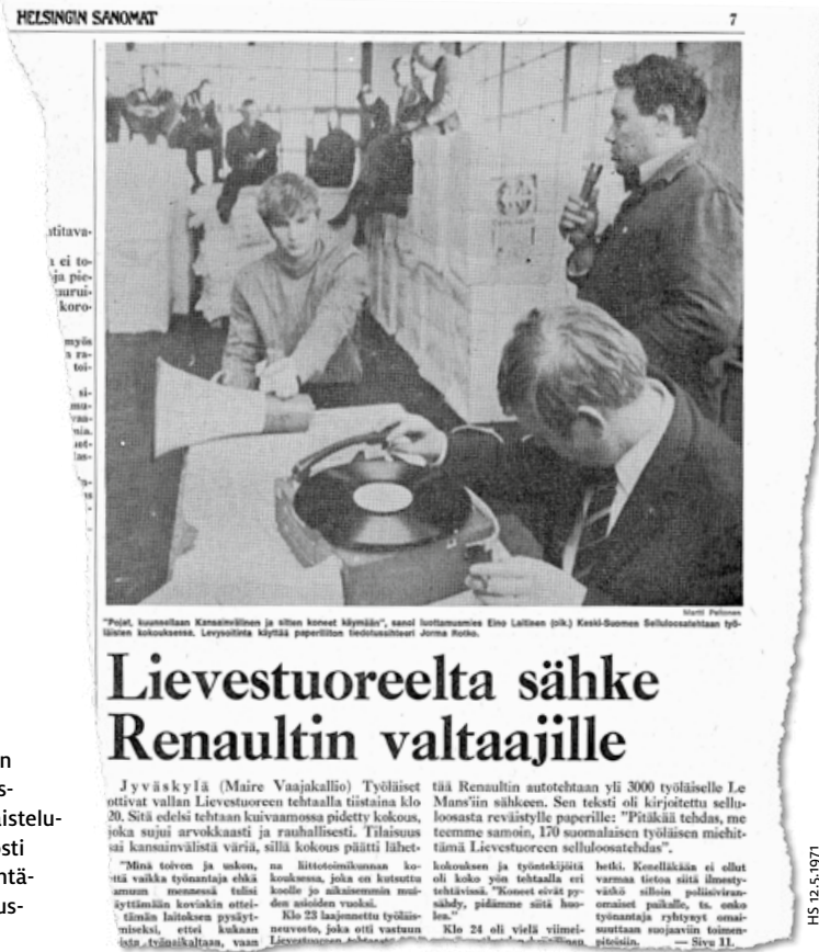
Kuva 2. Helsingin Sanomien valtaus-uutisoinnin työtaisteluro-mantiikka korosti valtaajien hyödyntä-mää vallankumous-retoriikkaa.

Ympäristöä ei vastaavalla tavalla käytetty kerronnan kärkenä. Uutisoinnissa ei kuvattu tehtaan jätevesistä kärsivien ranta-asukkaiden, kalastajien tai muiden virkistyskäyttäjien kohtaloita, vaikka osa heistä pyrki osallistumaan keskusteluun esimerkiksi mielipidekirjoituksin. Näyttävin esimerkki ympäristöstä dramatisoinnin välineenä oli Helsingin Sanomien paikalle lähettämien toimittajan ja kuvaajan reportaasi, jonka otsikko ironisoi tilannetta ja ajan vasemmistoretoriikkaa toteamalla: ”Tehtaan johto ja työläiset kerrankin yhtä mieltä: Saastuttamalla Päijänne saadaan työtä sadoille” (HS 28.3.1971). Koko reportaasia kehysti jonkinlainen ympäristöhuoli, sillä väliotsikoissa varoiteltiin esimerkiksi, että ”järvi saastuu muutamassa kuukaudessa” ja ”kalat kuolevat ajan mittaan”. Huoli tuotiin jutussa kuitenkin esiin leikinlaskun ja etäännyttävän ironian säestämänä.