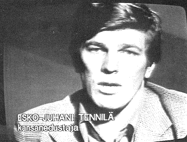
ESKO-JUHANNI TENNILÄ kansanedustaja