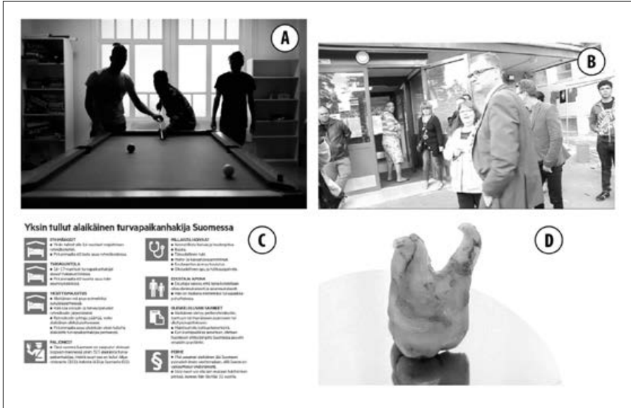
Kuva 3. Iänmäärittämiseen liittyvää uutiskuvitusta Aamulehti, Helsingin Sanomat ja Yle 2014–2016.

tilastollisina yksikköinä, numeroina, eikä heidän inhimillisille kokemuksilleen annettu sijaa. Infografikan valitseminen kuvitukseksi ohjaa faktuaaliseen luentaan, jossa ilmiö pelkistyy hallinnan tavoiksi ja kartoittamiseksi. Vastaava objektiivisuutta korostava visuaalisen esittämisen tapa oli kuvissa (ks. kuva 3d), joissa ikätestaukseen viitattiin oikeuslääketieteellisenä toimenpiteenä, ja kuvituskuviissa, jotka kuvasivat biopoliittista hallintaa. Kuvissa korostui ikätestaamisen lääketieteellinen täsmällisyys ja tulkitoihin vaadittava kliininen asiantuntijuus. Näissä uutisissa lääketieteellistä todentamista symboloi ihmisen hammas, joka osoittaa faktat yksilön kertomuksen sijaan (ks. Aas 2005; myös Tapaninen 2018). Uutiskuvat esittivät ikätestit objektiivista tietoa korostaen, mutta samalla kuvat olivat esitystavaltaan jopa rajuja, sisältäen muun röntgenkuvia pääkalloista. Yleisesti voidaan sanoa, että aineistomme ikätestaamiseen liittyvän kuvaston todentavan uhkadiskurssille tyypillistä tarkoin rajattua esittämisen tapaa. Tällöin esimerkiksi nuorten omaääniset kokemukset ikätestiin joutumisesta eivät nouse lainkaan uutisiin mukaan. Näin ollen ikätestaamiseen liittyvä valikoivaa hiljentämistä ja samalla se näyttäytyy erittäin voimallisesti maahanmuuton biopoliittisen oikeuttamisen keinona. Tämä nuoren kehoon kohdistuva oikeuttaminen ei näkynyt muissa tarkastelemissamme teemoissa läheskään näin selkeästi.