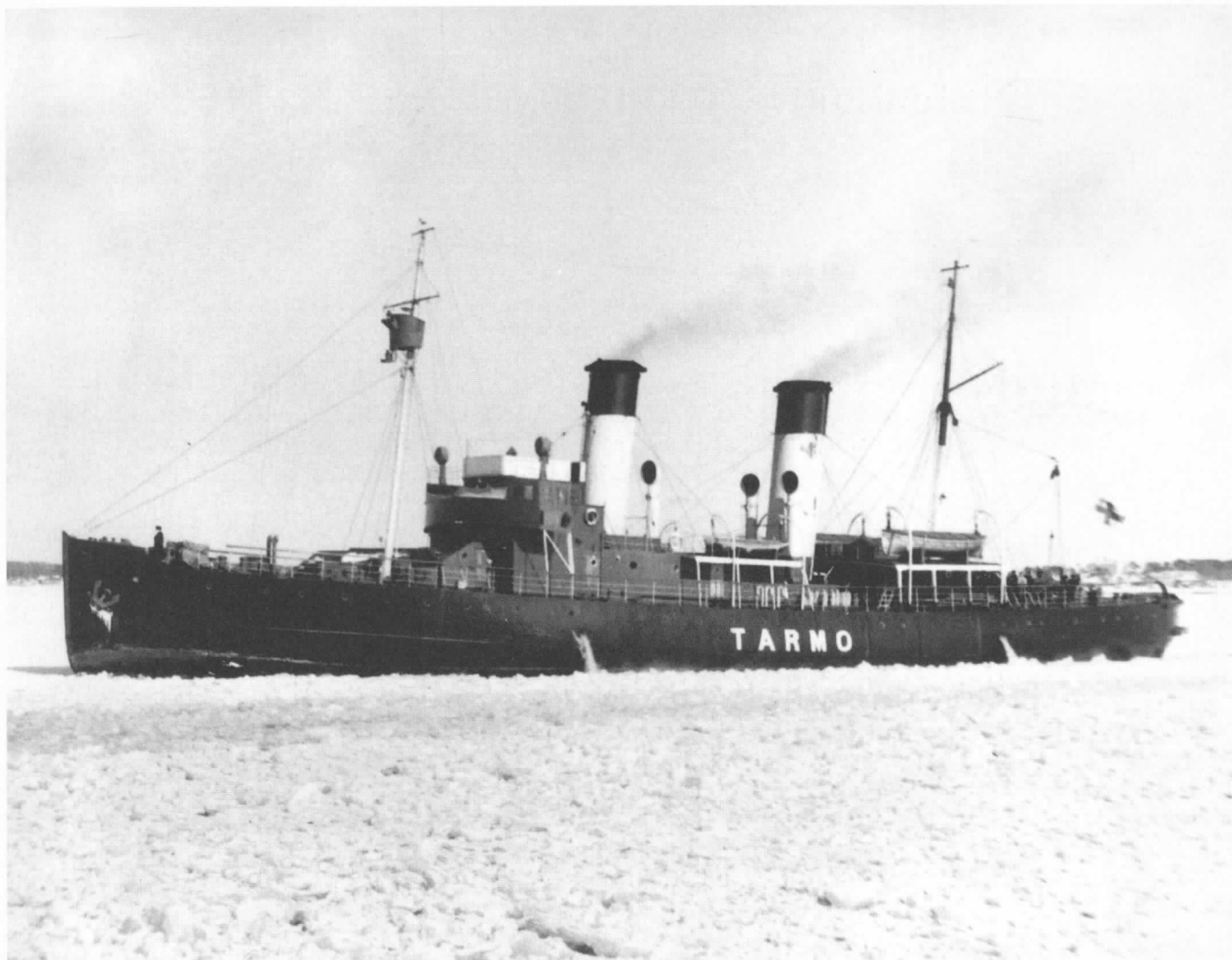
Kuva 1. Tarmo tulossa Kotkaan talvella 1952.