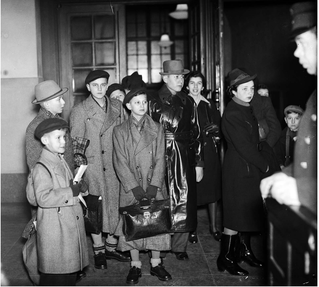
Judiska flyktningbarn anländer på Stockholms järnvägsstation den 16 februari 1939.

konflikter. Totalt uppges 175 ungdomar ha gått i skolan. Många återvände till Tyskland, men ett hundratal räddades från Förintelsen, däribland ett 35-tal som stannade i Sverige.