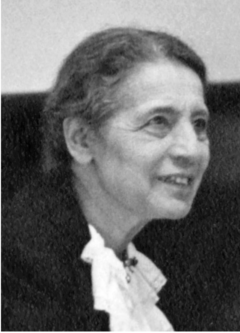
Lise Meitner.

Den vetenskapligt kanske mest framstående flyktingen var kärnfysikern Lise Meitner som kom 1938. Hon hade konverterat till kristendomen, men lydde under de tyska raslagarna. Hon föddes i Wien där hon doktorerade men kom tidigt till universitetet i Berlin och blev den första kvinnliga professorn i Tyskland. Hon hade blivit föreslagen till Nobelpriset i fysik 1936 tillsammans med Otto Hahn, men Hahn fick priset ensam 1944.