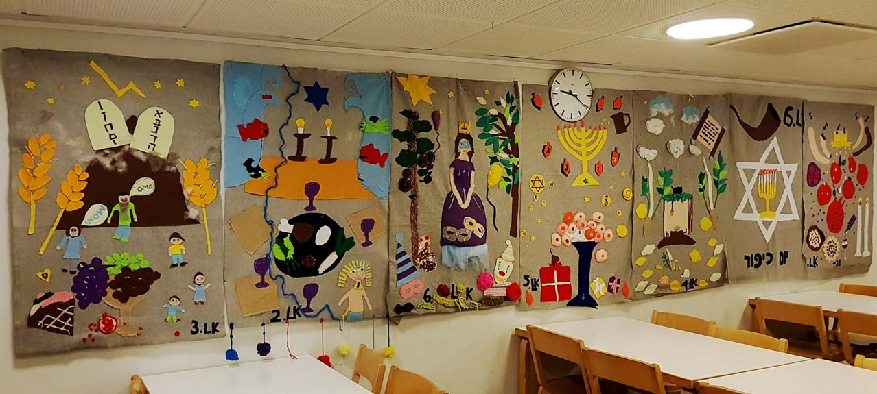
Elevernas konstverk i Helsingfors judiska samskola, oktober 2022.

finlandssvenska skolor och flera informanter som gått i svenskspråkiga skolor mellan 1970- och 2000-talen vittnar om negativ särbehandling, mobbning, oförståelse och antisemitism.