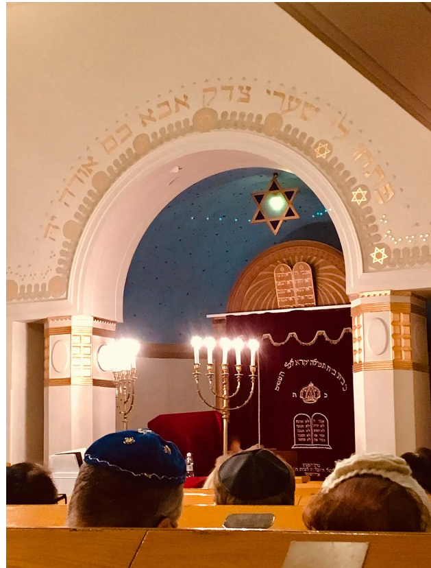
Hanukkakonsert i synagogan i Åbo, december 2019.