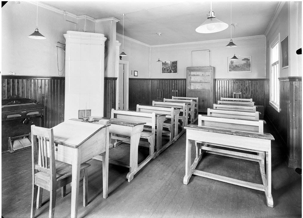
Klassrum i Judiska samskolan i Helsingfors år 1926.