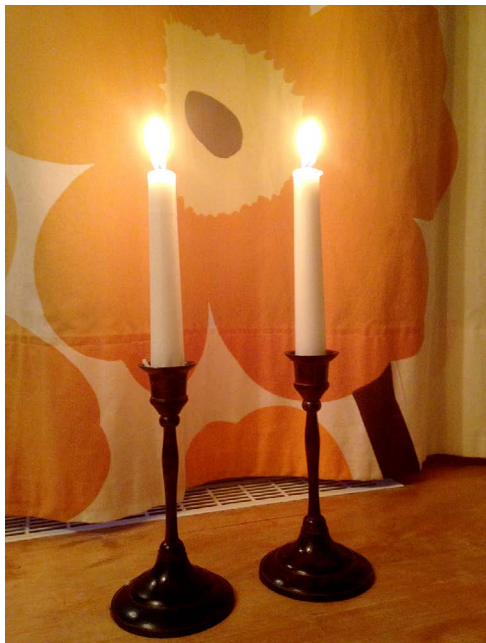
Finländska sabbatsljus mot Marimekkobakgrund.

Även åsikten att den finlandssvenska och den judiska minoritetsidentiteten snarare stöder än utmanar varandra i vardagslivet förekommer i intervjuerna. En informant berättar att hen växte upp i en icke-judisk familj där man ”höll på alla de finlandssvenska traditioner som idag sakta dör ut”. Då hen genom sitt giftermål blev del av en judisk familj förstod hen hur viktigt det är att aktivt upprätthålla även denna minoritetsidentitet ”eftersom jag levt som en minoritet redan tidigare”. De facto, anser hen: ”jag måste säga att det är lättare för en finlandssvensk att konvertera eftersom de har så många traditioner”. Att samla familjen till helgmiddag och olika högtider, laga traditionell mat och dekorera hemmet, allt sådant var för hen enkelt att överföra, med små modifikationer, från det finlandssvenska barndomshemmet till det judiska vuxenlivet. En informant född på 1960-talet ser också att de två minoritetsidentiteterna stöder varandra: