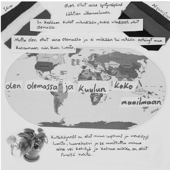
Kuva 1. Taideteos

Tämä kasvi (Kuva 2) oli se esine, jonka toin työpajaan. Se opetti minulle, että voin pärjätä vaikeissa olosuhteissa ja että kuuluun koko tähän planeettaan ja koko maapallon luontoon. Tämä kasvi oli meidän kotonamme riippumatta siitä, missä maassa tai kaupungissa asuimme. Se aina kasvanut ja pysynyt vahvana vaikeissa olosuhteissa. Kasvi muistuttaa minua myös siitä, että kuulun omaan perheeseeni, vaikka me emme laillisesti kuuluneet mihinkään. Kuten identiteettini, myös kuuluvuuteni on ihmissuhteissa.