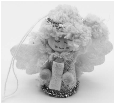
Kuva 3. Enkeli

Minun esineeni tässä työpajassa on enkeli (Kuva 3), jonka olen saanut tärkeältä ihmiseltä. Tämä enkeli symboloi minulle tätä tärkeää ihmistä. Hän asui samassa paikassa kuin