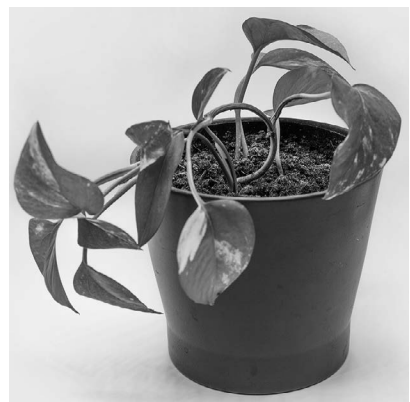
Kuva 2. Kasvi