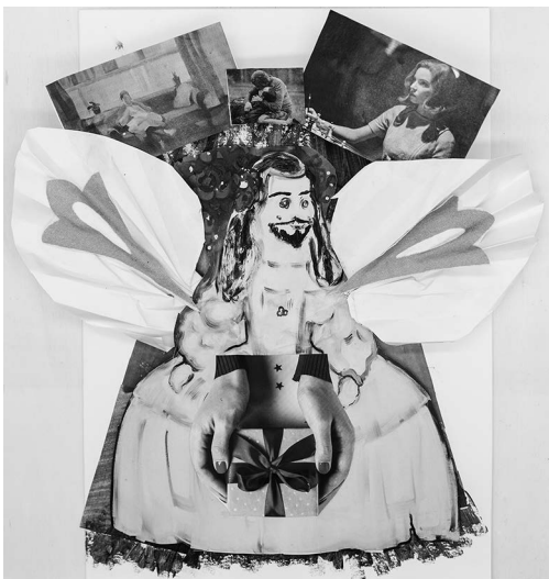
Kuva 4. Taideteos enkelistä.

minä ja hänen kanssaan pystyin jakamaan syvät tunteeni ja suuren osan elämästäni. Hänen kanssaan pystyin alkaa rakentaa uutta elämäni Suomessa ja luoda uutta persoonallisuuttani uudessa maassa. Kun aloitin nollassa, hän oli minun tukenani. Tämän vuoksi hän on minulle enkeli. Taideteoksessa (Kuva 4) enkelillä on samoja piirteitä, kuin tällä tärkeällä ihmisellä.