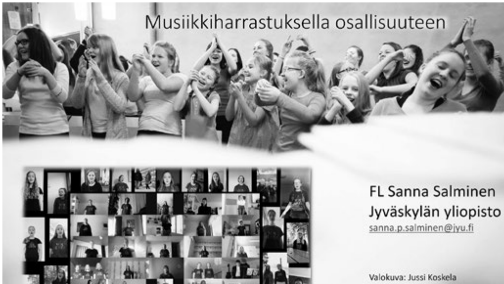
Kuva 1. Vox Aurea -nuorisokuoro.

he noin 25-vuotiaina tarkastelivat musiikkikoulutoiminnan merkitystä oman elämänsä kulussa. Kaikkien samojen oppilaiden tavoittaminen osoittautui kuitenkin mahdottomaksi. Lopulta neljä aikaisempaa musiikkikoulun oppilasta saapui haastatteluun.