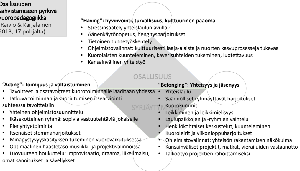
Kuvio 3. Osallisuuden vahvistamiseen pyrkivä kuoropedagogiikka (Salminen 2021 a).

Osallisuuden vahvistamiseen pyrkivä kuoropedagogiikka (Raivio & Karjalainen 2013, 17 pohjalta)