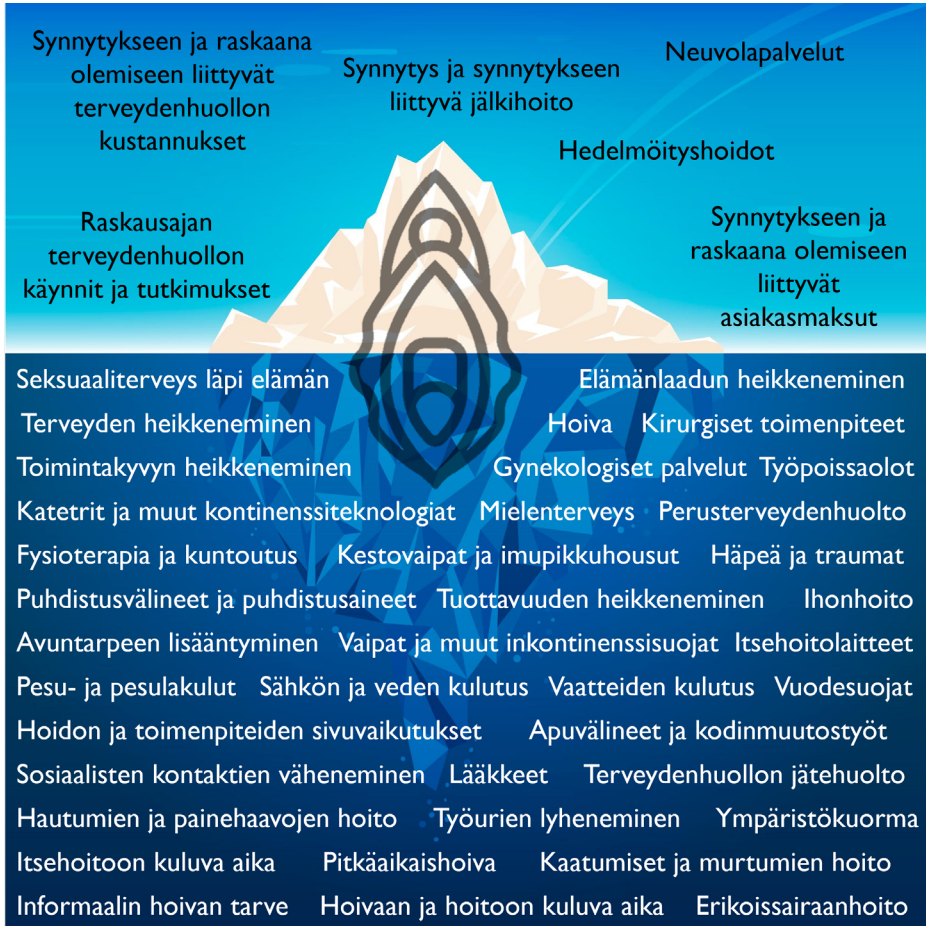
KUVIO 2. BIOLOGISEN UUSINTAMISEN VAGINAALINEN JÄÄVUORI INKONTINENSIN NÄKÖKULMASTA. POHJAKUVAN ELEMENTIT LÄHTEISTÄ FREEPIK.COM JA FLATICON.COM.