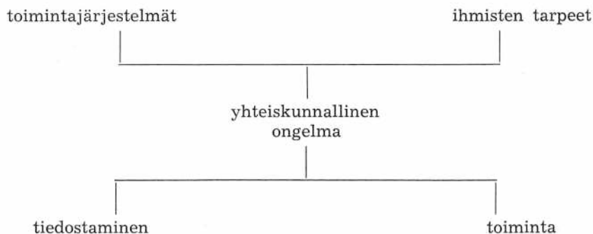
Kuvio 2. Yhteiskunnallisen ongelman kokonaisrakenne.

Toimintajärjestelmien toiminta ja ihmisten tarpeidentyydytyksen aste muodostavat yhteiskunnallisen ongelman objektiivisen perustan. Ongelman ympärille, sen sisältämän eriarvoisuuden tai syrjinnän paineesta, kasvaa tiedostusprosessi ja toiminta ongelman korjaamiseksi.