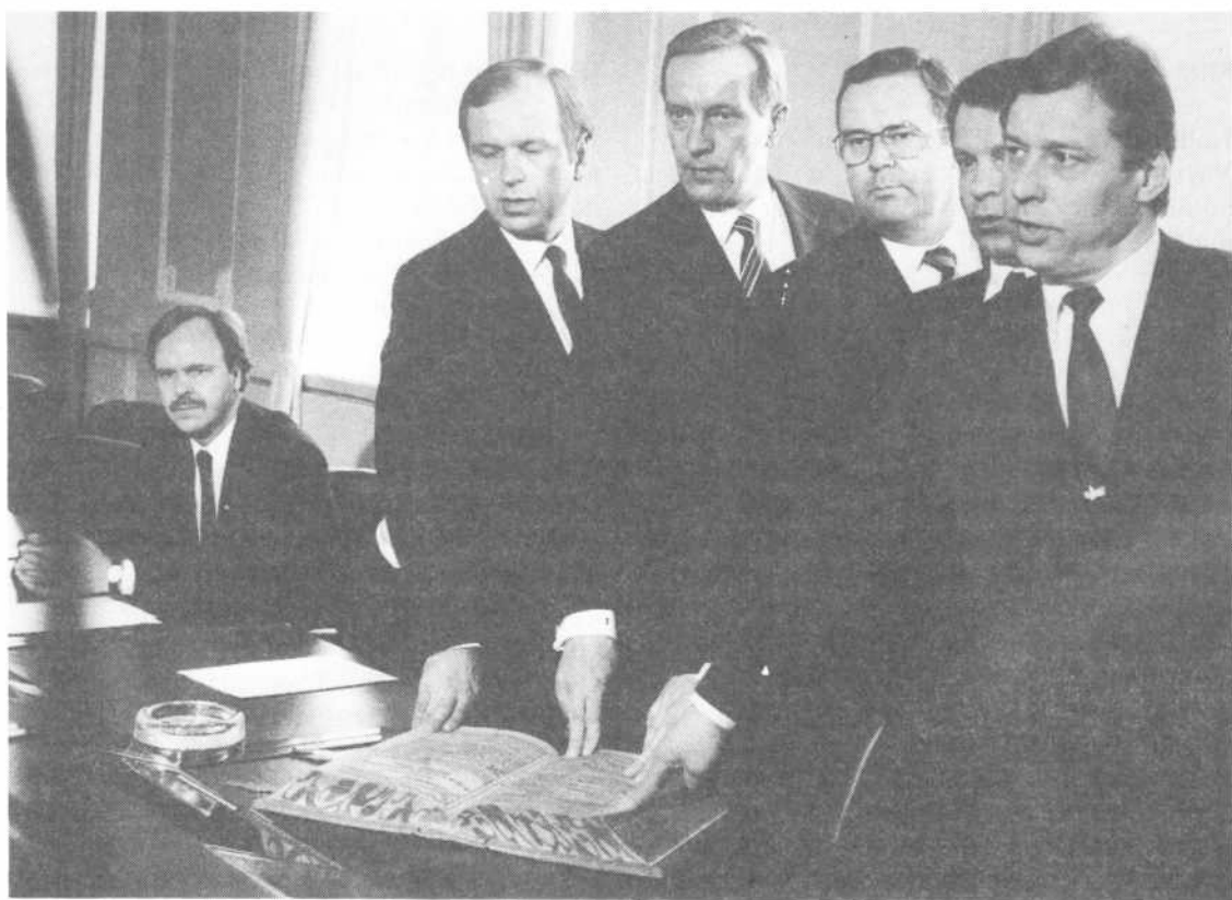
Uusi Suomi 1. 5. 1987.