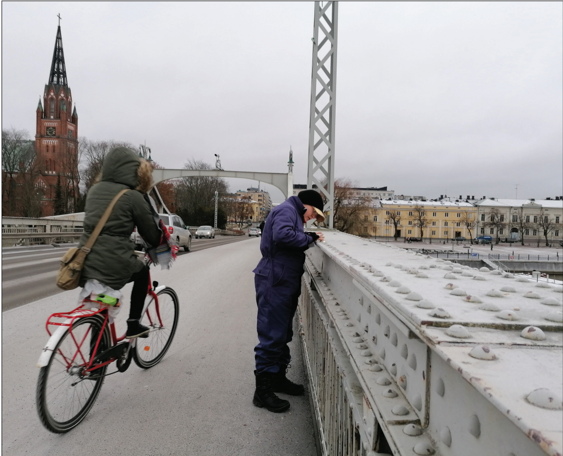
Kuva 6. Performanssitaiteilija Maire Karuvuori kulta Porin siltaa.