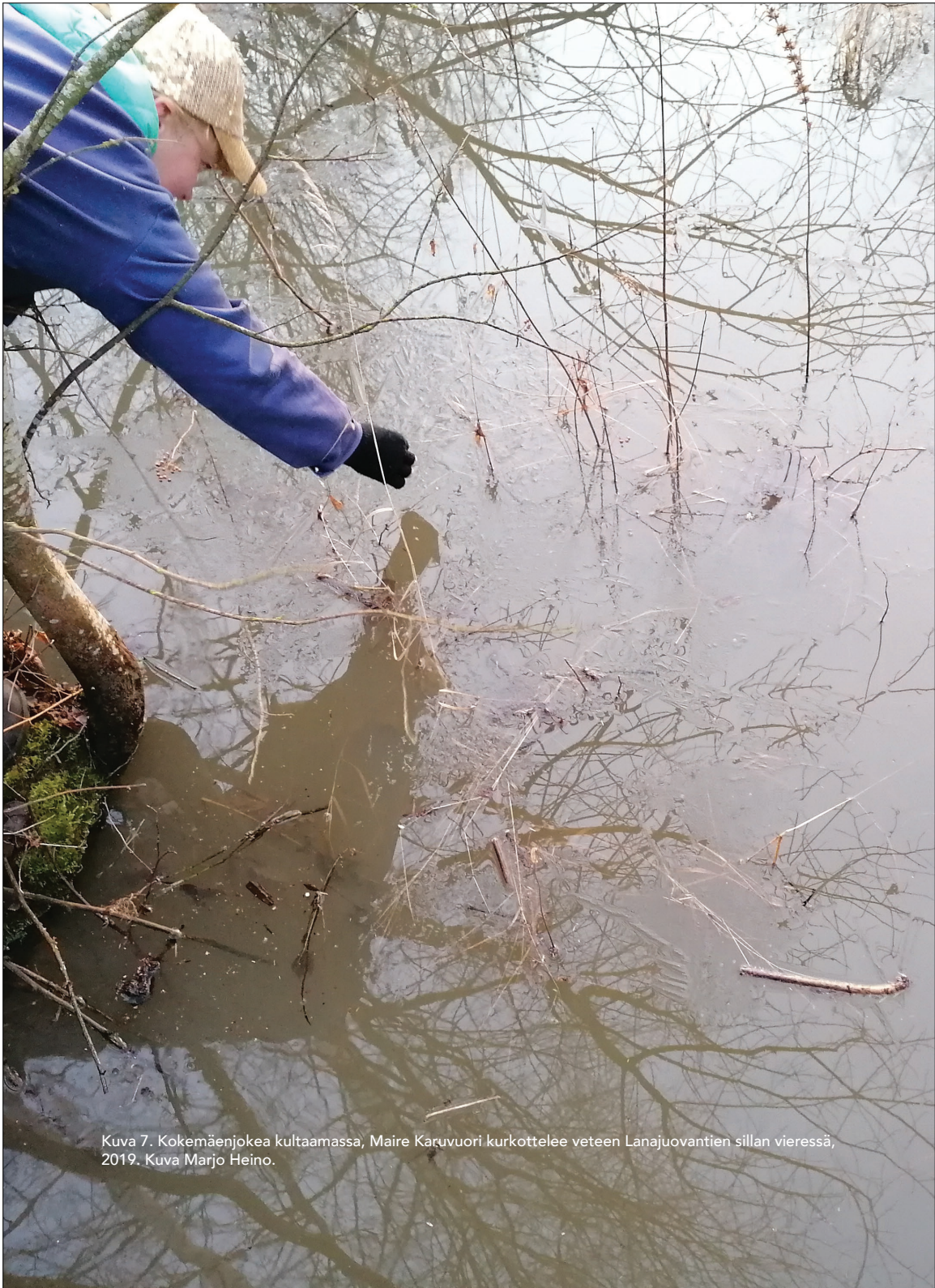
Kuva 7. Kokemäenjokea kultaamassa, Maire Karuvuori kurkottelee veteen Lanajuovantien sillan vieressä, 2019.