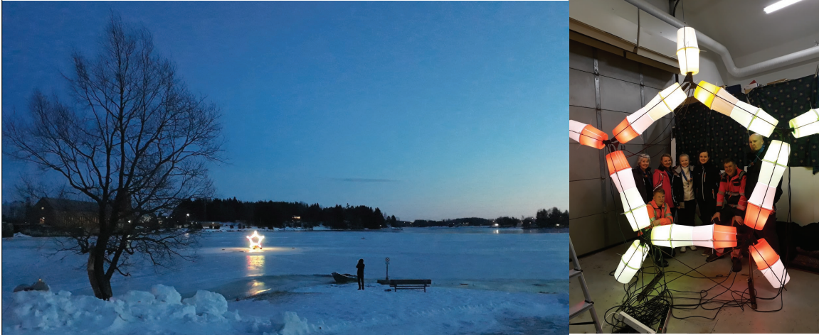
Kuvat 2 ja 3. Ratas-valoteos Äetsän voimalaitoksen alapuolella ja tekijät; Keikyän Korvenkävijät ja Keikyän perikunta.

Kerran kokoontuessamme levitimme ämpäreitä ympäriinsä, pyöritimme kuvioita ja kasasimme muotoja. Mietimme mitä haluamme sanoa, kun viemme ämpäreitä keskelle jokea. Millainen visuaalinen viesti on osuva, merkityksellinen ja näillä resursseilla mahdollista? Yksi ehdottaa jotain, toinen heittää idean, jonkun keksimä on liian vaativa, mutta lopulta viisikulmainen ämpäripareista koottava rakennelma muistutti Keikyän tunnusta ja se tuntui hyväksyttävältä, kaikista meistä. Ratas on myös Korvenkävijöiden logossa. Yhteinen ideointi oli tiivistä ja tavallaan voimauttavaa, siinä piti ottaa jokainen osallistuja huomioon tasavertaisena, luoda hyvä ilmapiiri, jossa voi keksiä, sanoa uskaliaasti, ehdottaa ja erityisen tärkeää oli, että lopulta näimme asian samoin.