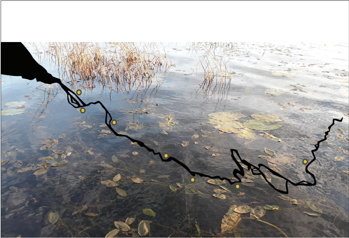
Kuva 8. Kokkelin taideprojekteja kartalla Kokemäenjokilaaksossa 2018–2020. Kuva Marjo Heino.