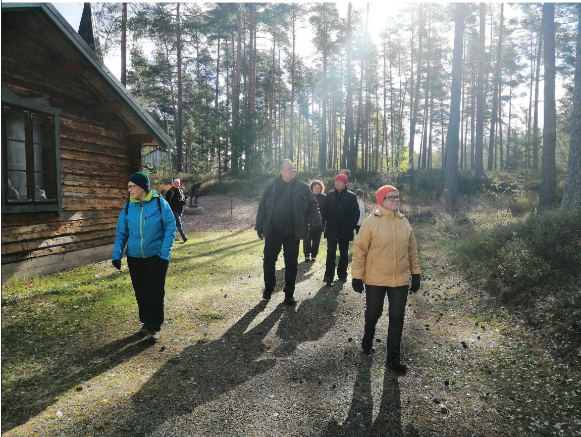
Kuva 4. Kuuntelukävely Harjavallassa Emil Cedercreutzin museon piha-alueella, 2019.

Yhteistyössä mukana oli myös Emil Cedercreutzin museo, joka toimi arvokkaana yhdyslinkkinä paikallisiin yhdistyksiin ja tarjoten näyttelytilaa kahdelle kuuntelukävelyistä koostetulle Alaston äänimaisema -ääniteokselle (Emil Cedercreutzin museo, 2019). Järjestimme museon kanssa kolme kuuntelukävelykertaa eri vuodenaikoina. Ensimmäinen sijoittui keskustaan tammikuisena pakkaspäivänä, toinen museoalueelle veden äärelle ja kolmas Paratiisilehdon luontopolulle kauniina kesäkuun iltana.