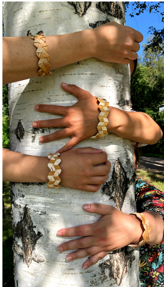
kuva 3: Tuohityöpajan päätöshetki. Kuva: Tatiana Kravtsov, 2020.

AMASS-hankkeessa tarkastellaan muun muassa kuvataidekasvatuksen ja kuvataiteen kokeiluita sosiaalisten ongelmien ratkaisemiseksi Euroopan reuna-alueilla. Teos Kohtaa puu -on sisällynyt AMASS-hankkeen kokeiluihin. Sen tausta on myös kansainvälisten tapahtumien International Socially Engaged Art Symposium Finland (ISEAS) (Huhmarniemi & Juhola, tulossa) ja Art Äkäslöpolo yhteistyönä toteuttamassa taidetyöpajassa, jossa yhteisötaide on toiminut interventiona ympäristökonflikteihin kyläyhteisössä (Huhmarniemi, 2018, 2021a, b).