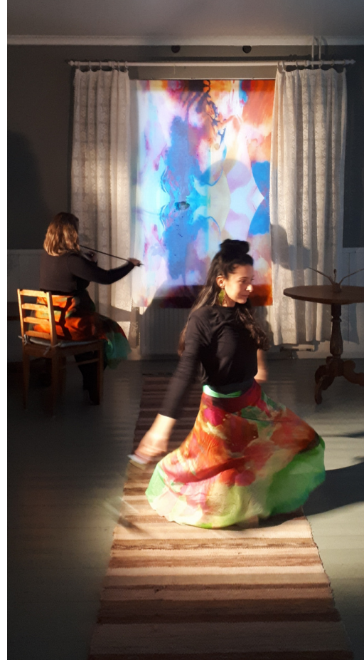
Kuva 1: Loitsutulet- tanssiesitys, Kuva: Minna Kovero, 2021.

Posthumanistinen filosofia avaa perinteisen yhteisökäsityksen laajeneviksi verkostoiksi, jotka sisältävät myös ei-inhimillisen luonnon, kuten myös koneet ja muun materiaallisen maailman (Lummaa & Rojola, 2014; Tammi & Hohti, 2017). Samaan aikaan tutkijat ovat todenneet taiteeseen osallistumisen ehkäisevän yksinäisyyden kokemusta (Perkins ym., 2021). Arvojen ja elämäntapojen syvälinen muutos on todettu välttämättömäksi kasvatuksessa ekososiaaliseen sivistykseen (Salonen & Bardy, 2015; Soini & Birkeland, 2014) ja taidekasvatuksessa eko- tai luontokulttuuriseen kestävyteen (Huhmarniemi ym., 2020; Huhmarniemi, Jokela ym., 2021). Myös taiteellisen ja taideperustaisen tutkimuksen metodikirjallisuudessa peräänkuulutetaan tutkimusta, joka johtaa aiempaa empaattisempiin inklusiivisempiin yhteisöihin (Siegesmund & Cahnmann-Taylor, 2008).