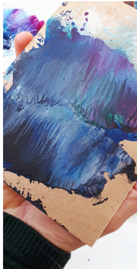
kuva 4: Yksityiskohta Loitsutulet -työpajan mehiläisvärimaalauksesta.

"Kun jokaisessa kortissa on erilaiset puunsyyt ja mehiläisvärereissä tuoksu ja muita aisteja, tekniikka avaa itsessään luonnon voimien luonnetta: kaikkea ei voi hallita, mutta voi oppia elämään ja luomaan mukana. Loitsutulissa puukortit ja mehiläisvahavärit toimivat luontosuhteen vahvistajana." -Taiteilija Minna Kovero, sähköpostiviesti Huhmarniemelle