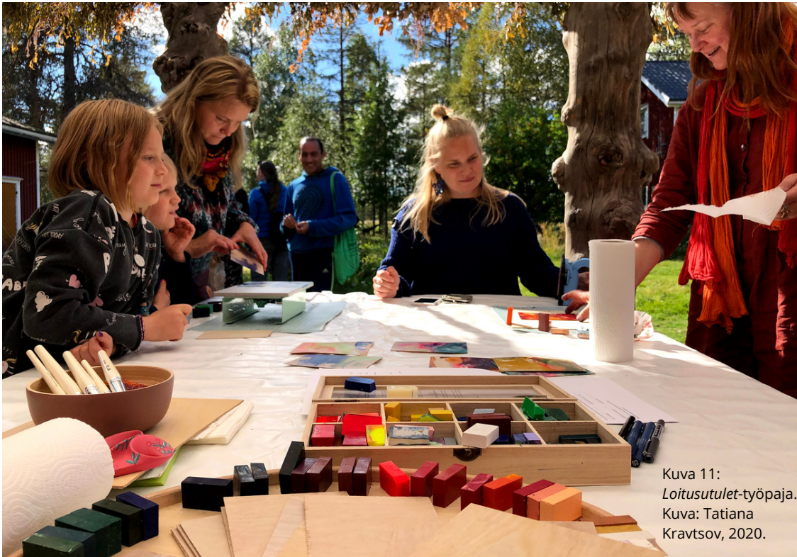
Kuva 11: Loitusutulet -työpaja.