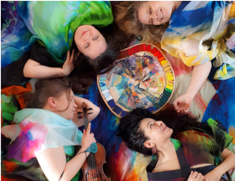
Kuva 2: Loitsutulet- työryhmä.