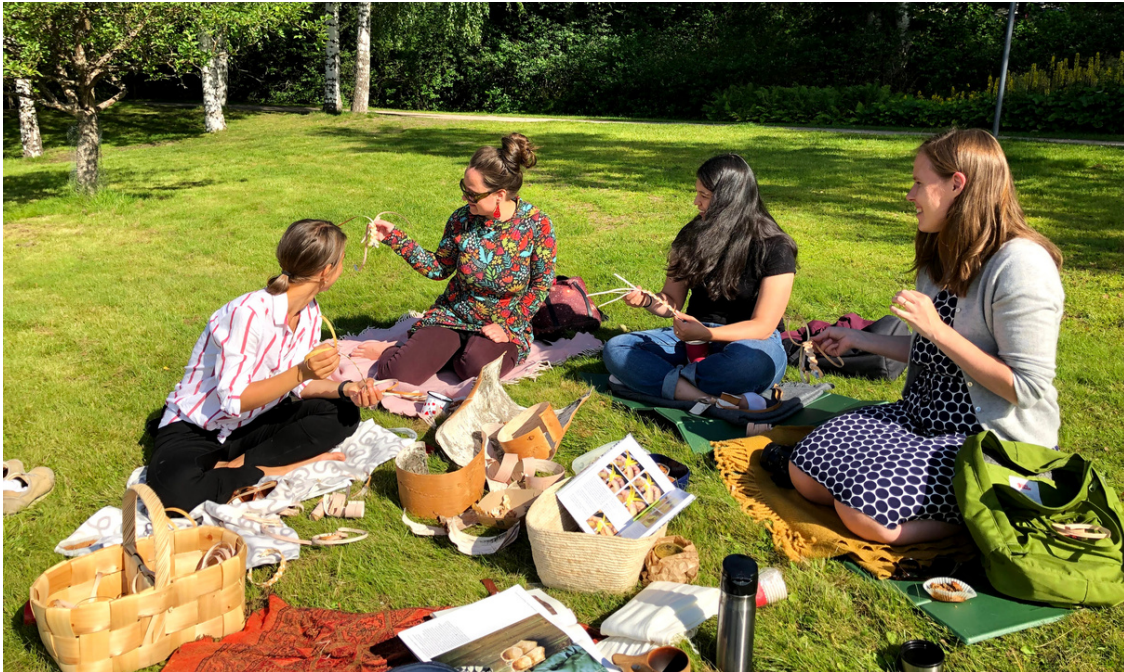
Kuva 7: Tuohityöpajan kokeilu puistossa.