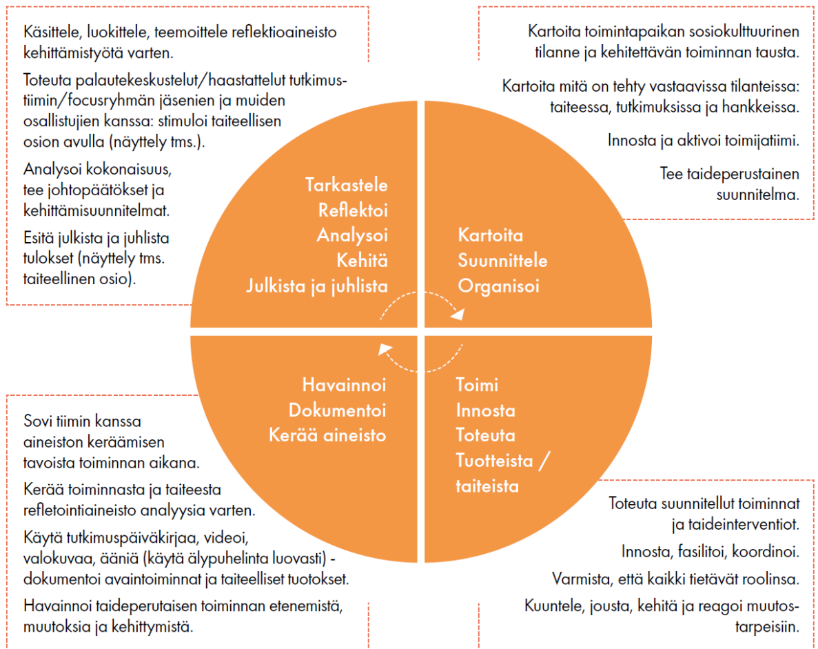
Kaavio 4. Taideperustaisen toimintatutkimuksen yhdessä syklin vaiheet (Jokela & Huhmar- niemi, 2020, s. 57).