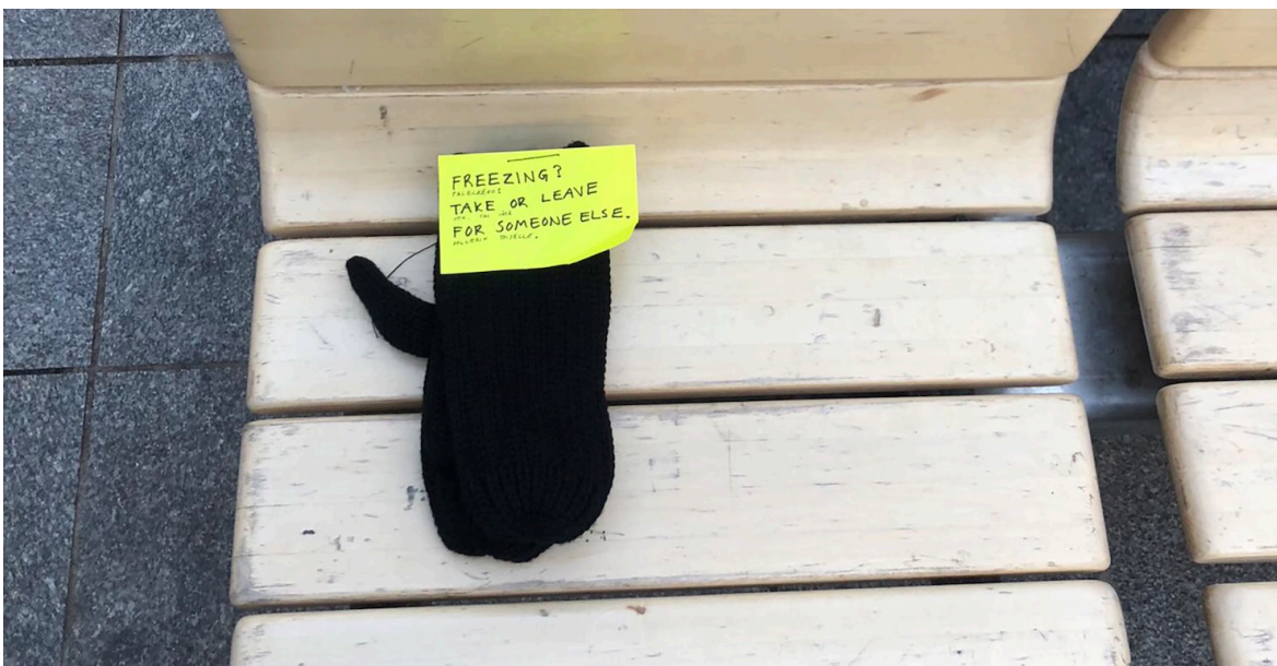
Kuva 13: Paleltaako? Opiskelijaryhmän taideteko metroasemalla. Dokumentaatiokuva Netta Alarto (2022).

Arlander ja Elo (2017) kuvaavat paikkasidonnaisen taiteellisen toiminnan ja tutkimisen eettistä perustaa ympäristön kautta ajattelemiseksi. Paikkasidonnaisessa taiteellisessa toiminnassa ratkaisujen tueksi ei useinkaan voi löytää yleisiä periaatteita. On otettava aikaa, avattava mielikuvituksensa ja oltava niin tarkkaavainen, erittelevä ja erotteleva kuin voi. Paikkojen erityisyys paljastuu suuntautumattoman olemisen ja aktiivisen kehollisen havainnoinnin rytmeissä. Olennaista on näennäinen passiivisuus, joka herkistää paikan ehdottamille taiteellisen toiminnan tavoille.