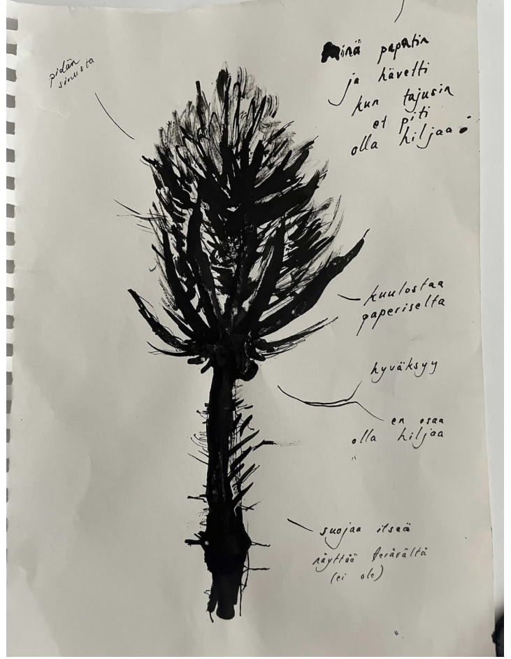
Kuva 12: Kiven aika, kasvin aika, ihmisen aika. Äänetön havaintoharjoite Kumpulan kasvitieteellisessä puutarhassa. Piirros ja muistiinpanot Mesi Parikka, dokumentaatiokuva Minna Suoniemi (2024).