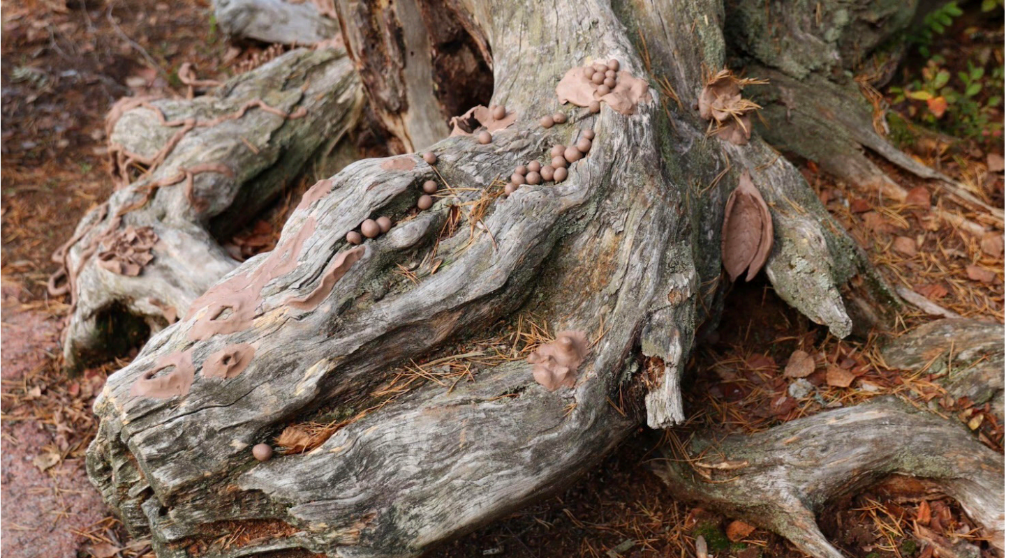
Kuva 17: Maatuvia pienoismaailmoja. Opiskelijaryhmän taideteko yliopistokampuksella.