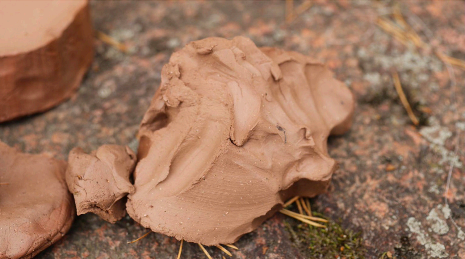
Kuva 4: Maatuvia pienoismaailmoja. Opiskelijaryhmän taideteko.