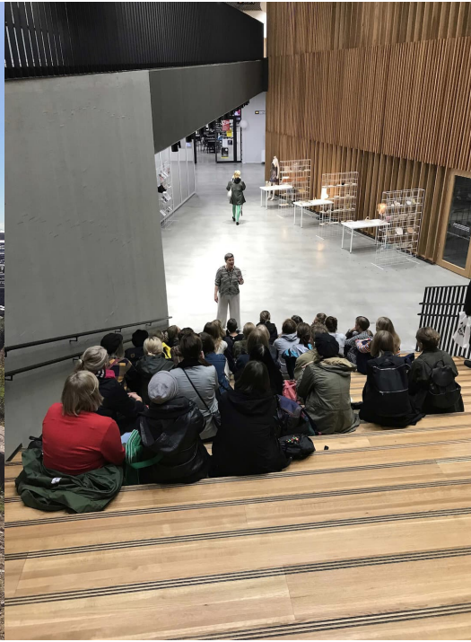
Kuva 2: Kurssi valmistautuu siirtymään.