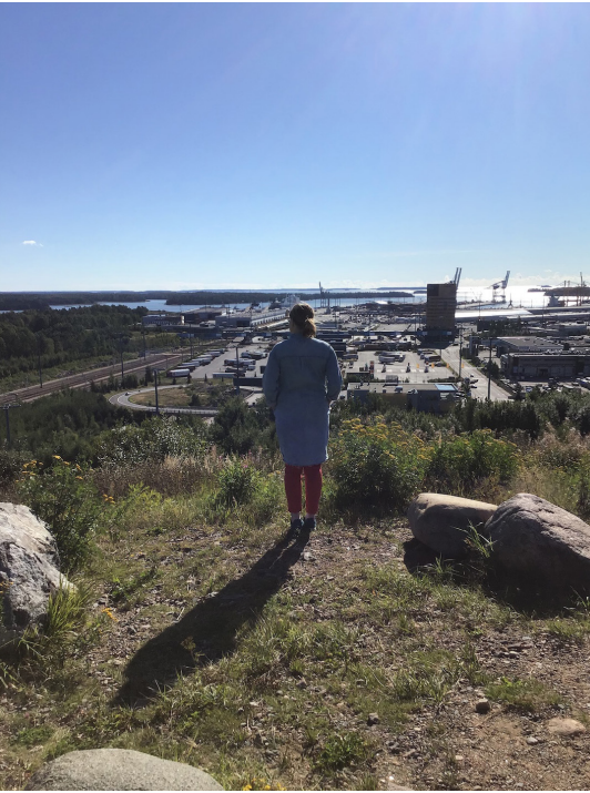
Kuva 1: Nykytaidekasvatus-kurssin suunnittelua Vuosaaren täyttömäellä.