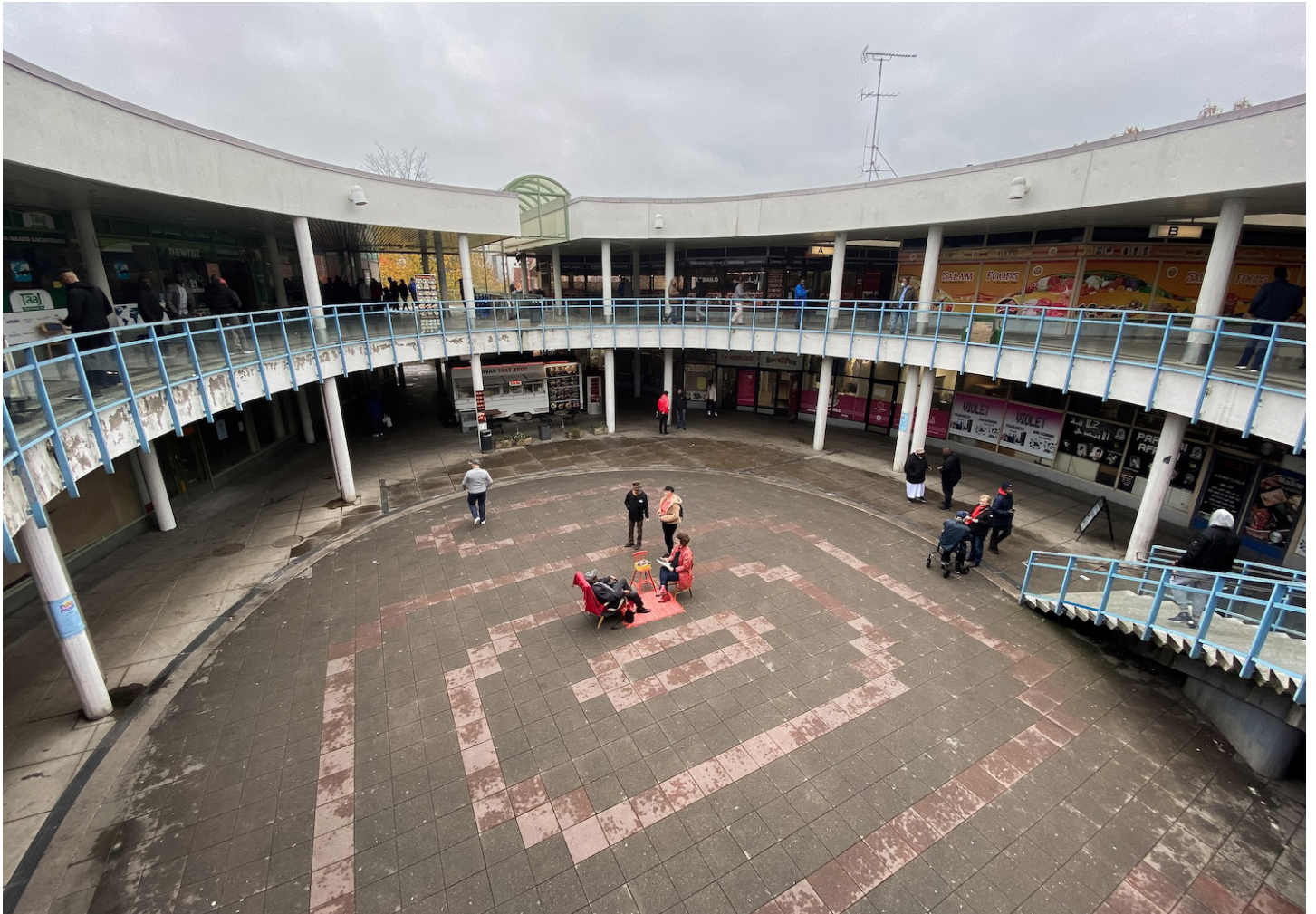
Kuva 7. Osallistava piirustustapahtuma Puhoksen kauppakeskuksen aukiolla. Opiskelijaryhmän taideteko.