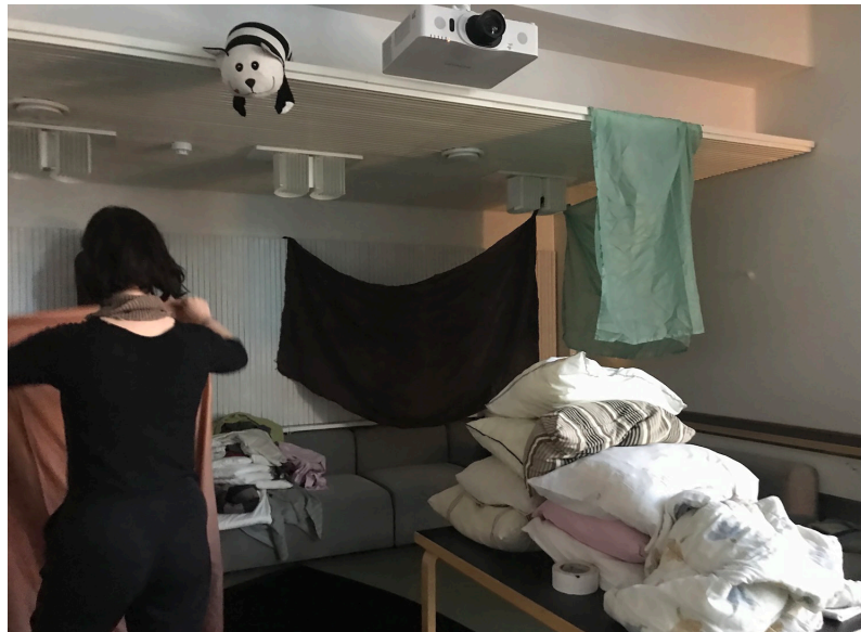
Kuva 16: Maja -installaatio rakentuu luokahuoneeseen. Opiskelijaryhmän osallistava taideteko.

Paikan pedagogiikan avoin tilanteisuus järjestelee uudeleen kehojen tapoja olla yhteydessä toisiinsa ja muihin paikkoja asuttaviin. Valmiiden toimintamallien puuttuessa paikat kutsuvat lähestymisiin, etääntymisiin, esiin tulemisiin ja vetäytymisiin. Ne ehdottavat kullekin mahdollisuutta olla sosiaalinen omalla tavallaan.