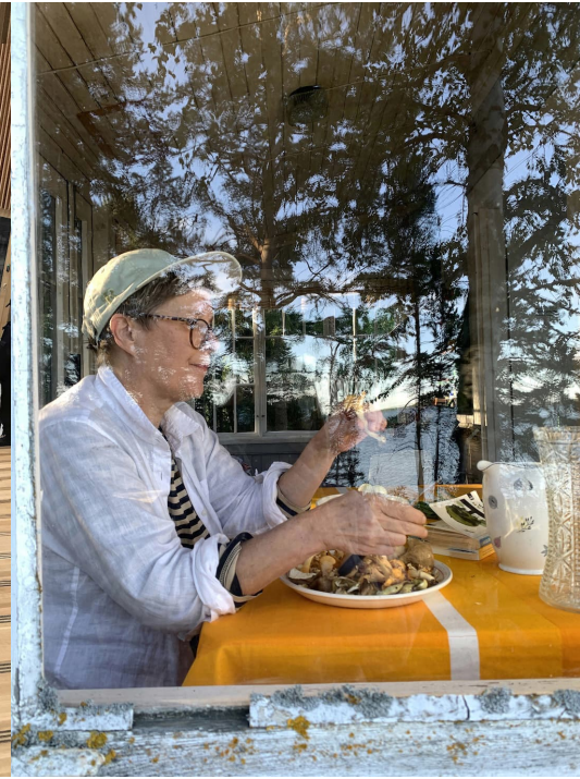
Kuva 3: Aineistojen äärellä Lempiäniemessä. Dokumentaatiokuva Minna Suoniemi (2023).