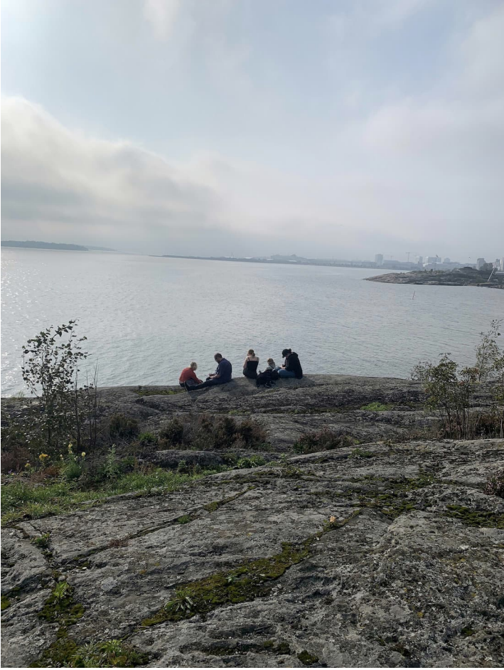
Kuva 5: Saaren kanssa. Harjoite Harakan saarella.