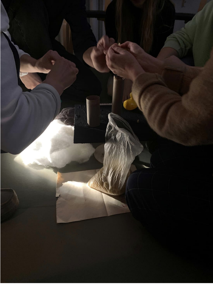
Kuva 11: Pienoisveistostyöpaja luokkatilassa. Opiskelijaryhmän osallistava taideteko. Dokumentaatiokuva Minna Suoniemi (2023).