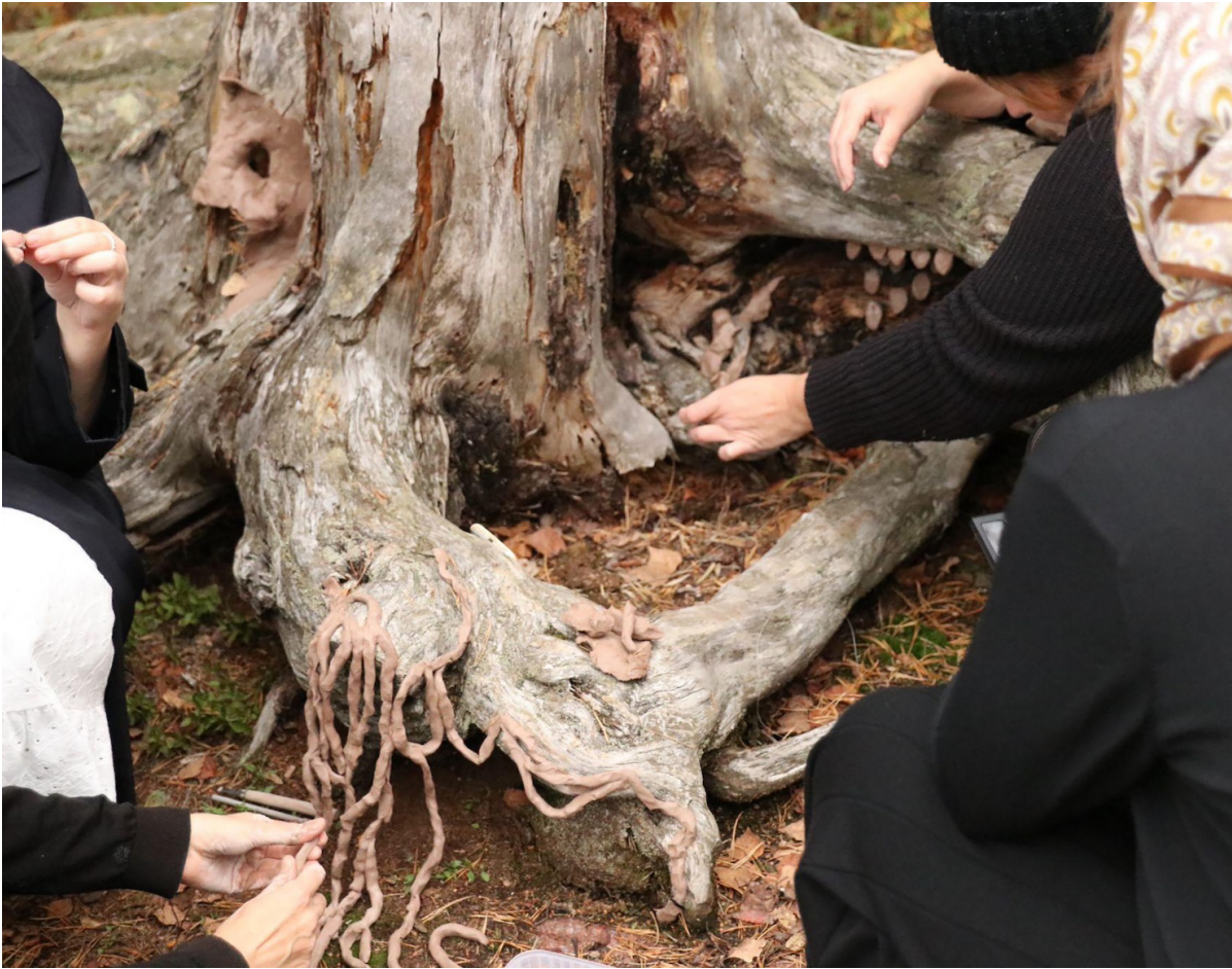
Kuva 9: Maatuvia pienoismaailmoja. Opiskelijaryhmän taideteko yliopistokampuksella.