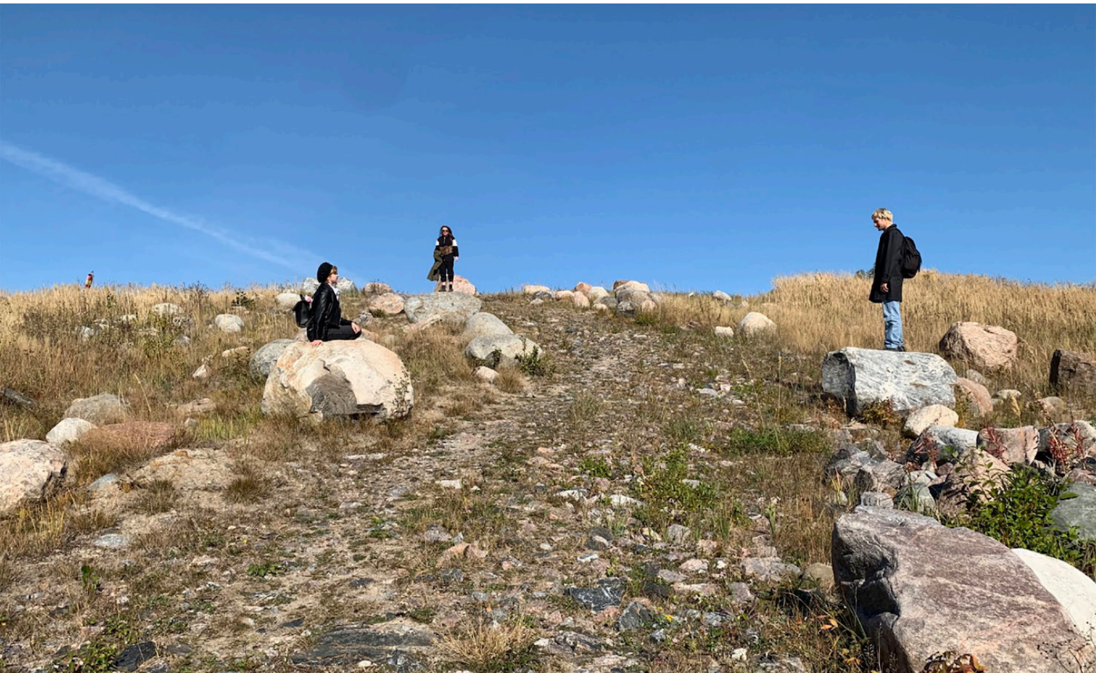
Kuva 10: Vuosaaren huippu. Kävelyharjoite täyttömäellä.