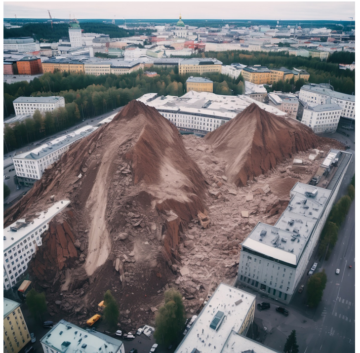
Kuva 8: Kasvava kallio 1. Matti Sampela 2023. Digitaalinen kuva opiskelijaryhmän osallistavassa installaatiossa (2023).

muille. Kertomus havainnollistaa paikan pedagogiikan taide- ja oppimiskäsitysten prosessuaalisuutta ja performatiivisuutta. Se myös tuo esiin teknologian orgaanisen läsnäolon paikan pedagogiikan toimintatavoissa. Osallistava ääni-installaatio luo paikan ei-olemassa-olevan yhdessä kuvittelulle. Samalla se herättää kysymyksiä niin teknologian materiaalisuudesta kuin inhimillisten kehojen kytkeytymisestä toisiinsa teknologioiden luomien maailmojen kautta. (vrt. Braidotti, 2019/2024; Trafi-Prats, 2017.) Kollektiivisten prosessien katveeseen jäävät kokemukset taas avautuvat meille opettajille kurssin pienimuotoisten yksilöllisten tutkimustehtävien ja harjoitusten kautta.