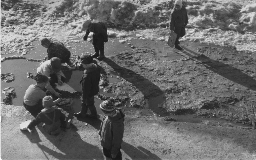
Kuva 2. Pihapiirin kaupunkilaislapsia keväisissä patoleikeissä vuonna 1956. (TYKL/dg/6608.)

uimarannalle. Kun perhe muutti keskusta Lauttasaareen, lapset käyttivät sujuvasti bussia kaupungissa liikkumiseen. (TYKL/aud/1117.) Lapsena opittu helppo liikkuminen busseilla tuli ilmi myös muiden kaupungissa kasvaneiden haastattelussa. (Kuva 2, TYKL/aud/1119; TYKL/aud/1122.)