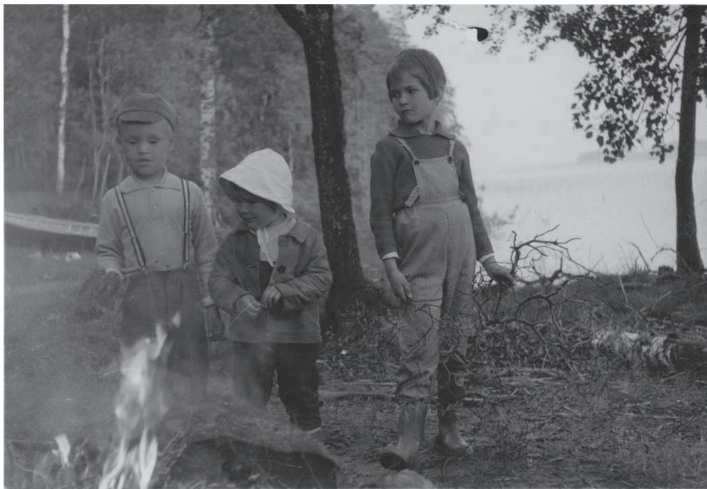
Kuva 1. Rissalan varuskunta-alueella kasvaneet sisaruksat pääsivät usein läheiseen, puolustusvoimien omistamaan saareen viettämään vapaa-aikaa. Tässä tunnelmallisessa kuvassa sisaruksat polttelevat risuja 1960-luvun lopulla. (TYKL/dg/6437.)

Varsinkin pikkukaupunkien elinympäristö oli monin tavoin verrannollinen maaseudulle. Vielä 1900-luvun puolivälissä oli esimerkiksi tyyppillistä, että pikkukaupungeissa talojen pihalla oli omat pienet puutarhat ja pihakarsinassa saattoi olla elätinä teuraaksi eläimiä (TYKL/spa/1190). Selvästi kaupunkimaisin lapsuusympäristö oli Helsingin keskustassa. Osittain lähes ydinkeskustassa 1950- ja 1960-luvuilla kasvanut mies pohti muun muassa, että kerrostalokodin sisäpiha oli ehkä aikuisen silmin ankea mutta lapsille jännittävä. Kotitalon ulkopuolella kaupunkilaislasten reviiiri ulottui leikkikentälle ja