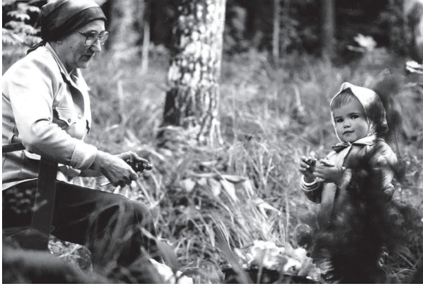
Kuva 3. Mummolat olivat paikkoja, joissa arjen toimintavoista lomanvieton rutiinit siirtyivät luontevasti suvun nuorimmille jäsenille. Tässä kuvassa pieni tyttö on mummonsensa kanssa sienimetsässä 1980-luvun alkuvuosina. (TYKL/dg/7741.)