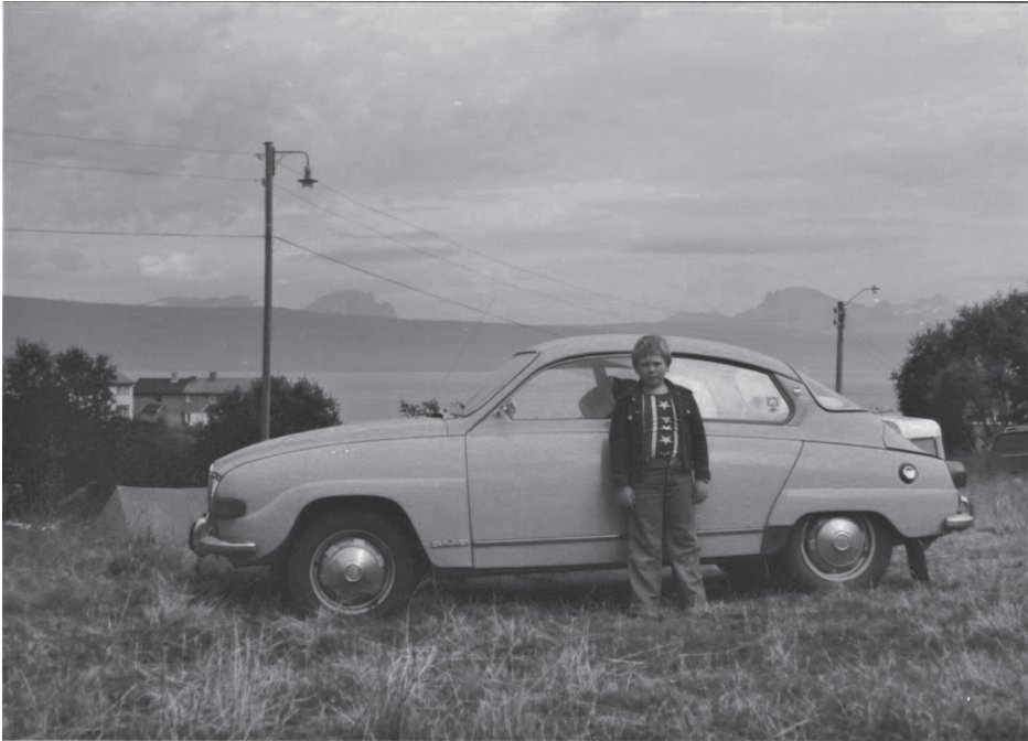
Kuva 4. Oma auto laajensi perheiden liikkumasädettä erityisesti 1960–1970-luvuilla, ja monet suvun jäsenistä muistelivatkin perheen autoja ja muita kulkupelejä yksityiskohdaisesti ja tarkoin. Kuvan poika on isänsä kanssa kalastusreissulla Norjassa 1970-luvun puolivälissä. (TYKL/dg/7790.)