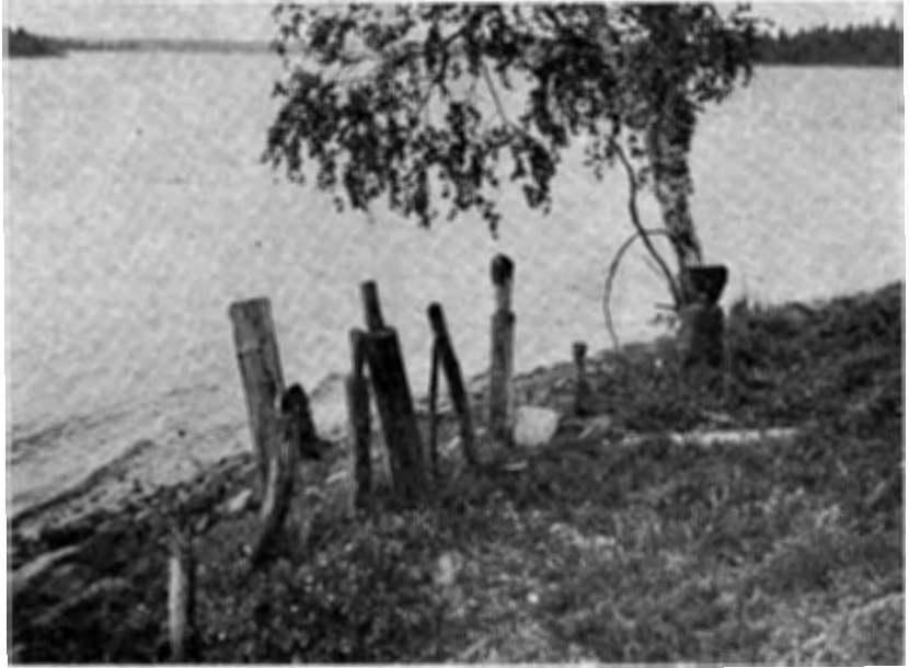
Kuva 5. "Kalapattahia Heikin haudan apajalla" Kemijärven Javaruksessa. Valok. Eino Nikkilä 1939. Kansallismuseon kokoelmat.

Täällä on niemi, jota köngäs kiertää ja jonka poikki on taival. Taipalen ja könkään välillä on toista kymmentä puupatsasta, varustetut vuosiluvuilla ja puumerkeillä sekä venäläisillä ja suomalaisilla kirjaimilla. Kaksi vanhinta ovat vuosilta 1763 ja 1789, kumpaisetkin venäläisellä kirjoituksella; yksi on vuodelta 1843 suomalaisella nimellä ja vuosi 1863 venäläisillä. — — — Kivipatsaat ovat pieniä, tehdyt päällitysten ladotuista kivilaakoista. Niitä mainittiin ainoastaan yhdessä simpukanpyyntipaikassa Ailankajoen niskassa Kemijärvellä. Paikalle tultuani huomasin, että kaikki kivipatsaat olivat kaatuneet. — — — Ne olivat seisoneet suurilla paasikivillä, ihan veden äyräällä... Opas sanoi niiden olleen noin kyynärän korkuisia, rakennetut vaaksan, kahden ja kolmen vaaksan suuruisista kantillisista kivilaakoista. Muutoin oli paasien rakoihin pistetty noin puoli kymmentä puupatsasta, samanlaisia kuin yllä kerrotut." 37