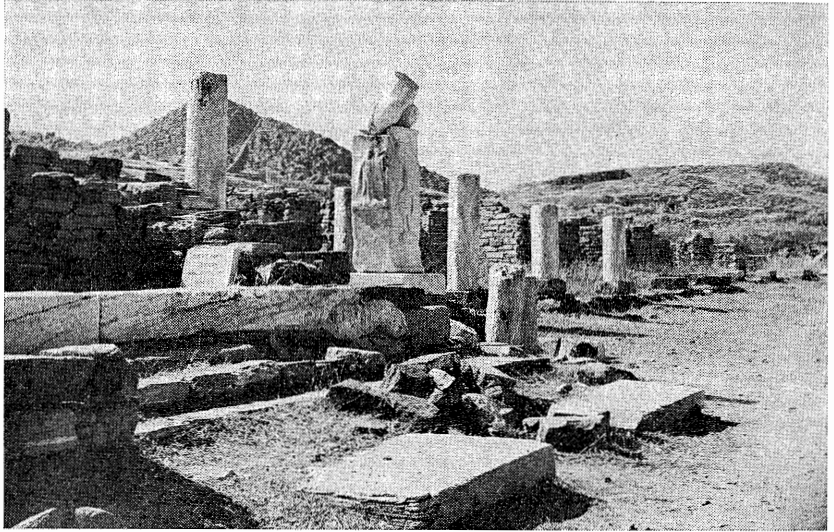
Kuva 9. Kuvan 8 fallos toisesta kulmasta; taustalla ja etualalla Dionysoksen temppelin raunioita.

tavasta Rödstenin punainen maalaus todennäköisesti juontuu. Muinaiset kreikkalaiset puolestaan veistivät marmorista hienoja naturalistisia kivialloksia ja koristivat niillä Delos-saarella olevan Dionysoksen alttarin ympäristön, ks. kuvat 8 ja 9; ainakin yhdessä näistä falloksista pää lienee jo alun perin muovattu eri kappaleesta. 53 Toisteita falloskultista tunnetaan myös Virosta, palatakseni Suomen suvun piiriin. Henrik Lättiläinen, joka kertoo kronikassaan mm. virolaisten kristinuskoon käännättämisen traagisista vaiheista 1200-luvun alkupuolella, mainitsee lähetysaarnaaajan hävittäneen virumaalaisten pyhästä lehdestä ”kuvat ja kaltaisuudet”, ”jolloin kansa ihmetteli, ettei niistä verta vuotanut”. 54 Kun ”kuvat” jokseenkin varmasti tarkoittavat ihmisenkaltaisia jumalia, niin mitäpä muuta mer-