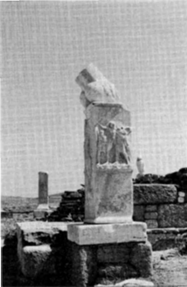
Kuva 8. Marmorifalloksia Delos-saarelta: edessä katkennut, taustalla ehyt.

falloksia ovat pystyttäneet myös Afrikan neekerheimot, asettaen tosin falloksen pääksi ainakin toisinaan saviastian. 52 Tällaisia falloksia on palvottu mm. uhraamalla ja sivelemällä niitä verellä, mistä