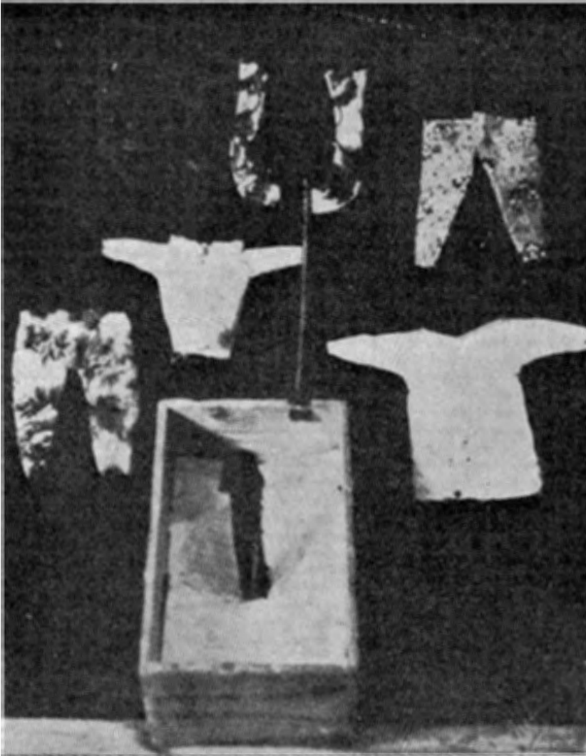
Kuva 10. Tõndi valk Vändrasta. Kaarle Krohnin mukaan.

kitsisivät 'kaltaisuudet', elleivät falloksia; ainakin tämä selitys johtuu ensimmäisenä mieleen.