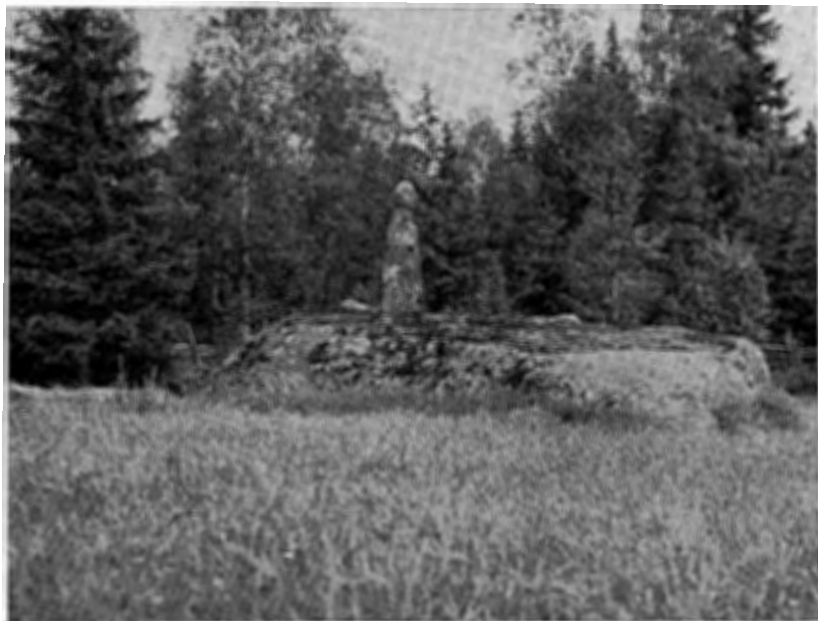
Kuva 2. Marjalan Isopelto on toisen kivitontun valtapiiriä.