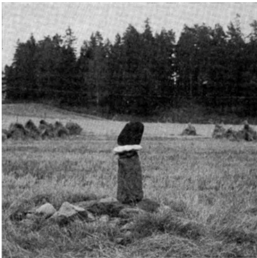
Kuva 7. Itä-Göötanmaan Rödstenin kunnan Rödsten on hämmästyttävän luonnontekoinen fallos.

jumin kurikan muodossa jo rautakautta edeltävään kulttuuriperinteeseen; eräistä viitteistä päätellen se on levinnyt pelloilta myös pyyntipaikoille.