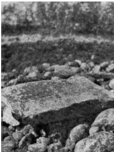
Kuva 4. Iin Ulkokrunnin Äijänharjun kalaajumala kivikoon kaadettuna.