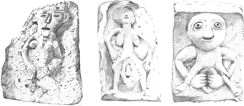
Kuva 3. Sheela-na-gig, Llandrindod, Wales; Sheela-na-gig, Oaksey ja Sheela-na-gig, Kilpeck, Englanti. Kaksi jälkimmäistä ovat edelleen in situ : Oaksey'n Sheela on paikallisen, 1200-luvulta peräisin olevan kirkon seinässä ja Kilpeckin Sheela St Maryn ja St Davidin kirkossa, joka valmistui noin vuonna 1140. Llandrindodin Sheela on tällä hetkellä Radnorshire Museumin kokoelmassa. Piirrookset: Darren Maher.

pääkuorien kaariin, jotta niitä oli mahdoton koskettaa ja jotta niiden ympäri oli mahdotonta kävellä, kuten vanhoissa riiteissä usein tehtiin. Nämä uudet Sheelat eivät enää kuvanneet elämän ja kuoleman symboliikkaa, sillä Sheelojen ala- ja yläruumis eivät juuri enää eronneet toisistaan (esimerkiksi käy Kilpeckin Sheela) eivätkä välttämättä edes muista veistoksista. Myöhemmin kirkko halusi kokonaan eroon Sheeloista eikä enää rakennuttanut niitä osaksi muuta kirkkotaidetta, joten sittemmin Sheelat jatkoivat eloan linnanomistajien ansiosta linnanmuureissa ja -seinissä (Freitag 2004, 112-115).