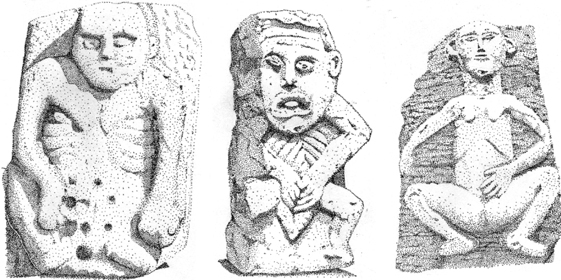
Kuva 1. Sheela-na-gig, Sier Kieran; Sheela-na-gig, Cavan ja Sheela-na-gig, Ballylarkin. Kaikki kolme Sheelaa kuuluvat Irlannin kansallismuseon kokoelmaan.