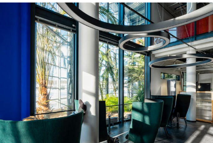
Viikin kampuskirjaston tiloja, taustalla Niilin puutarhaa.

Viikin kampuskirjasto ja samassa rakennuksessa oleva kaupunginkirjasto avattiin uudistettuina syksyllä 2021. Remontin jälkeen saatiin enemmän yhteistä tilaa opiskeluun, paremmat