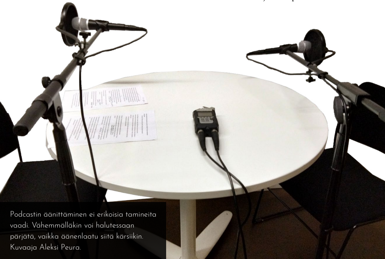
Podcastin äänittäminen ei erikoisia tamineita vaadi. Vähemmälläkin voi halutessaan pärjätä, vaikka äänenlaatu siitä kärsiikin.

Äänityksen jälkeen alkoi mekaanisempi työvaihe: keskustelusta pitää tehdä jakso. Tätä varten äänitasoja on säädettävä, tunnusmusiikkia lisättävä, taukoja editoitava pois, ja niin edelleen. Itse olen ottanut kannan, että pyrin editoimaan puheenvuoroja mahdollisimman vähän, sillä haluan kulloisenkin vieraan saavan tuoda oman asiantuntemuksensa esiin heille luontevimmalla tavalla. Joku toinen varmasti editoisi jokaisen puhutun kielen