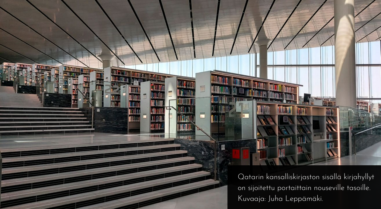
Qatarin kansalliskirjaston sisällä kirjahyllyt on sijoitettu portaattain nouseville tasoille.

taa yhdessä enemmän maksuttomalla aineistojen yhteiskäytöllä?