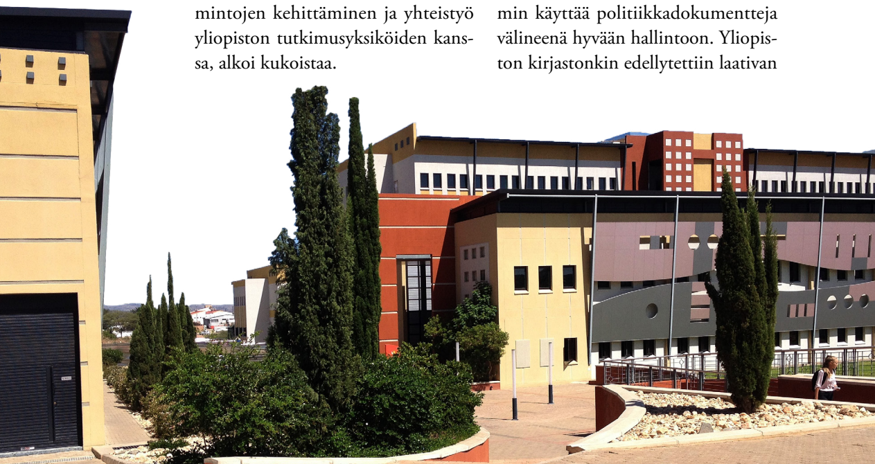
UNAMin arkkitehtonisesti kaunis terveystieteiden kampus Windhoekissa aloitti toimintansa 2010. Se on hyvin varustettu nykyaikaisilla laboratorioilla ja monipuolisilla opiskelutiloilla. Vuonna 2016 valmistuivat ensimmäiset Namibiassa koulutetut lääkärit.

N amibiassa yliopisto, kuten julkinen sektori yleensä, alkoi näinä vuosina yhä tiukemmin käyttää politiikkadokumentteja välineenä hyvään hallintoon. Yliopiston kirjastonkin edellytettiin laativan