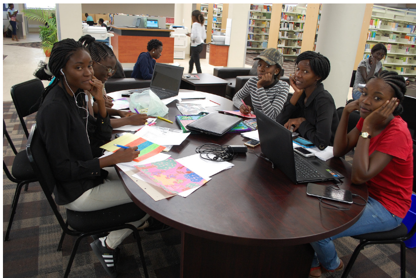
Yliopiston kirjastot aktiivisessa käytössä. HP kampus Ongwedivassa.

Kirjaston johto kuitenkin luopui LibQUALin käytöstä tämän jälkeen siksi, että välinettä ei ymmärretty laajemmin. Surveyn väittämätyyppiset