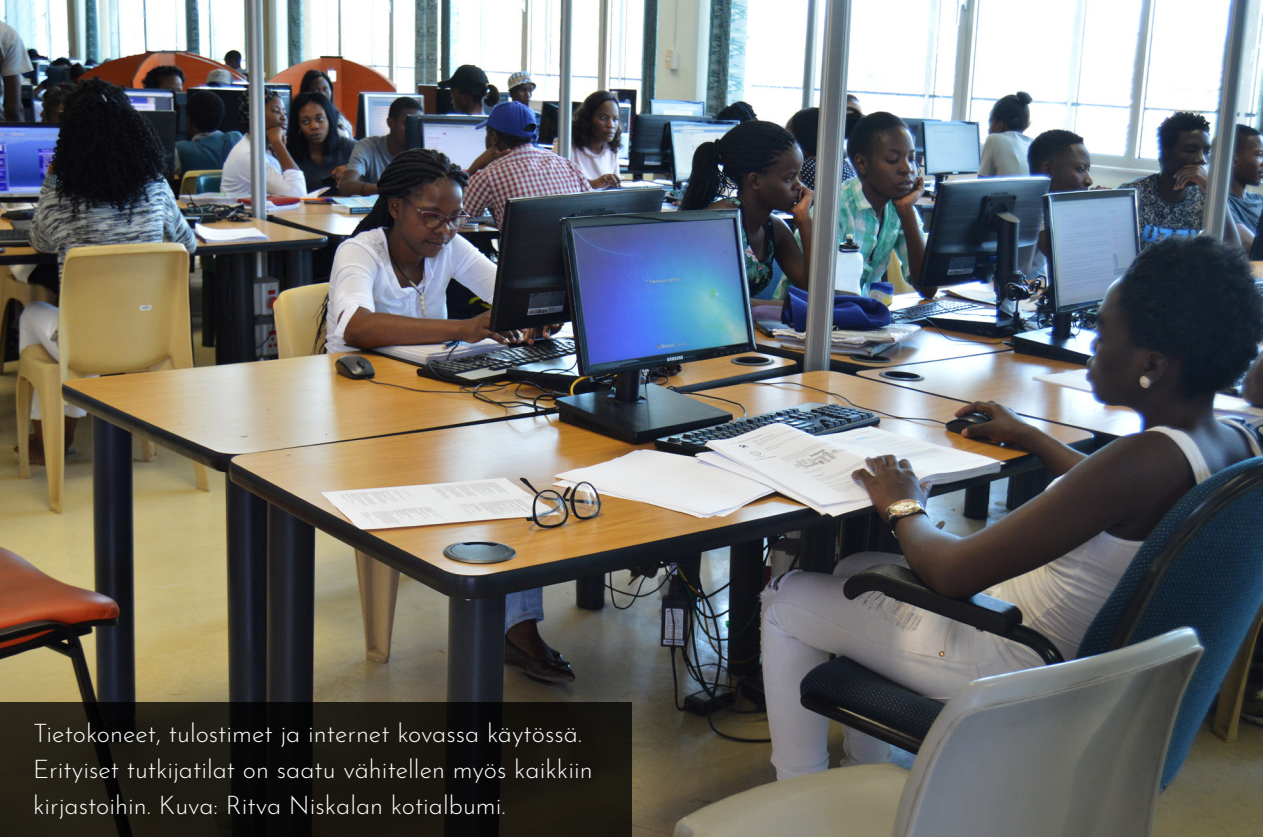
Tietokoneet, tulostimet ja internet kovassa käytössä. Erityiset tutkijatilat on saatu vähitellen myös kaikkiin kirjastoihin.

kattavat kirjastopolitiikat, jotka säätelisivät sen toimintaa. Kirjastossa oli jo perinteinen kokoelmapolitiikka, jonka viimeistelyyn olin osallistunut. Sen lisäksi oli vain yliopiston asiakirjanhallinnon periaatteet sekä kirjastonkäytön säännöt.