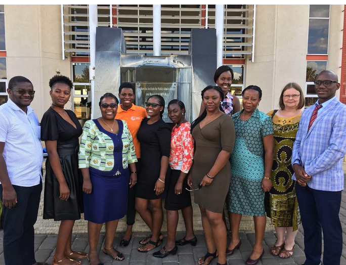
Tietopalvelualan yhteistyötä. Olin mukana "National Information Workers Association of Namibia" -työryhmässä, joka suunnitteli ja toteutti vuonna 2021 Windhoekissa pidetyn Afrikan maiden tietopalvelualan SCECSAL konferenssin.

N amibiasta oli tullut toinen kotimaani. Tunsin kuuluvani sinne. Elin maan todellisuudessa työn ja ihmissuhteiden kautta sekä seuraamalla päivän tapahtumia sanomalehdistä, netistä ja radiosta. Namibiassa kirjoitetaan paljon elämäkertoja ja niiden lukeminen toi hienon lisän historian ja sosiaalisen todellisu-