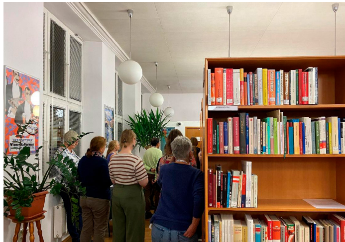
Konferenssikävijät vierailulla Jagellon yliopiston kirjaston sisällä sijaitsevassa Itävallan kirjastossa.