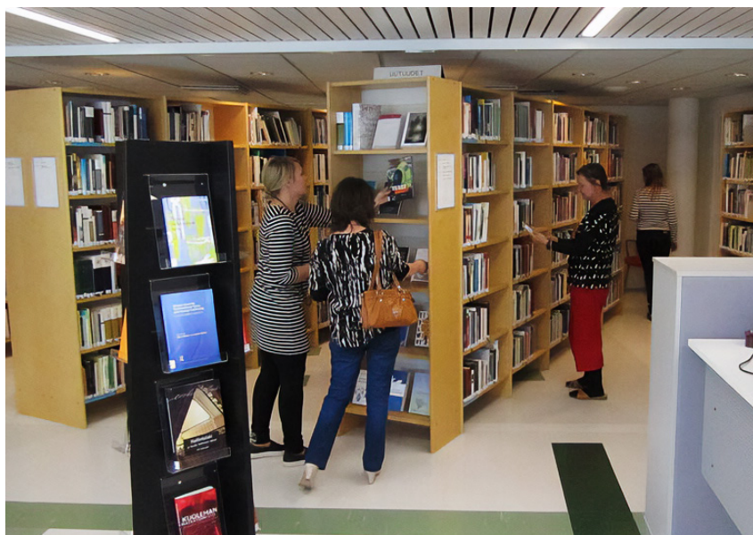
Kriminologinen kirjasto palvelee kaikkia rikosseuraamusalan tiedonlähteistä kiinnostuneita.

Kriminologinen kirjasto on tarjon- nut vuodesta 2017 asiakkailleen e- ja äänikirjoja Ellibs-alustan kautta. Tällä hetkellä, alkuvuodesta 2024 Suomessa on kolme ”älykästä vankilaa”, ja Kri- minologisen kirjaston e-kirjapalvelu on näissä kirjastoissa vankien käytössä sellipäätteillä joidenkin muiden julkis- hallinnon yleishyödyllisten palveluiden