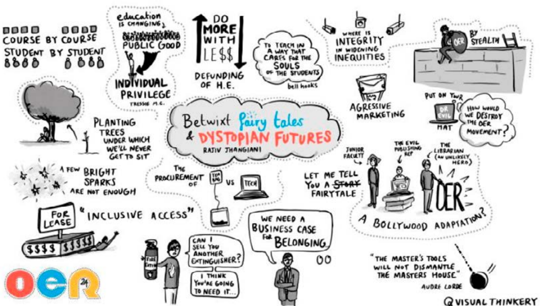
Kuvio 3. Kooste Rajiv Jhangianin esityksen pääkohdista, Bryan Mathers, CC BY-ND 4.0

Esityksen lopussa Czerniewicz ja Cronin suuntasivat katseen kohti tulevaisuutta. Avoimen oppimisen edistäminen edellyttää laaja-alaista yhteistyötä, monipuolisia tutkimushankkeita sekä riittävää resurssointia. Esitys tallennettiin videolle (You Tube) ja Bryan Mathers koosti visuaalisesti esityksen avainkohdat (kuvio 4). Esityksen kalvot löytyvät verkosta .