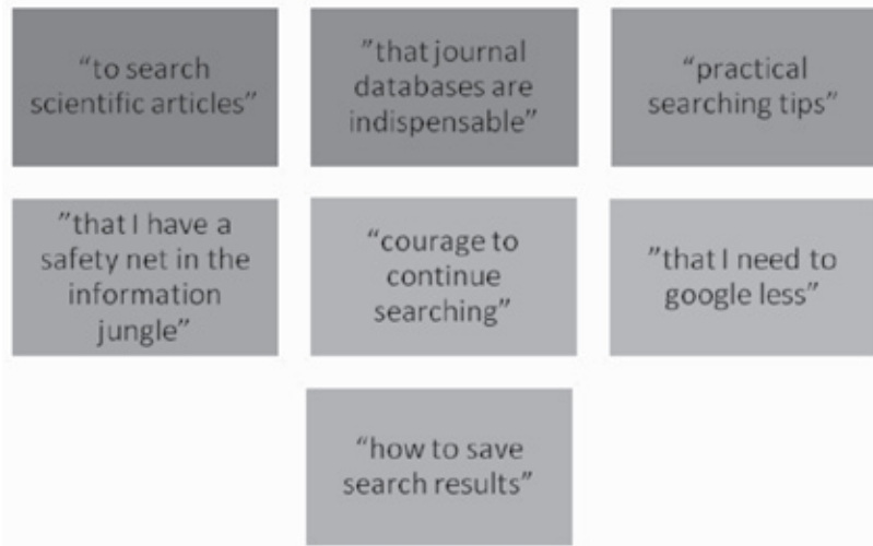
Kuva 3. Opiskelijoilta saatuja vastauksia ”Tärkein koulutuksessa oppimani asia”

Palaute on tärkeää koulutusten kehittämisessä ja opettajien työmotivaation ylläpitämisessä.