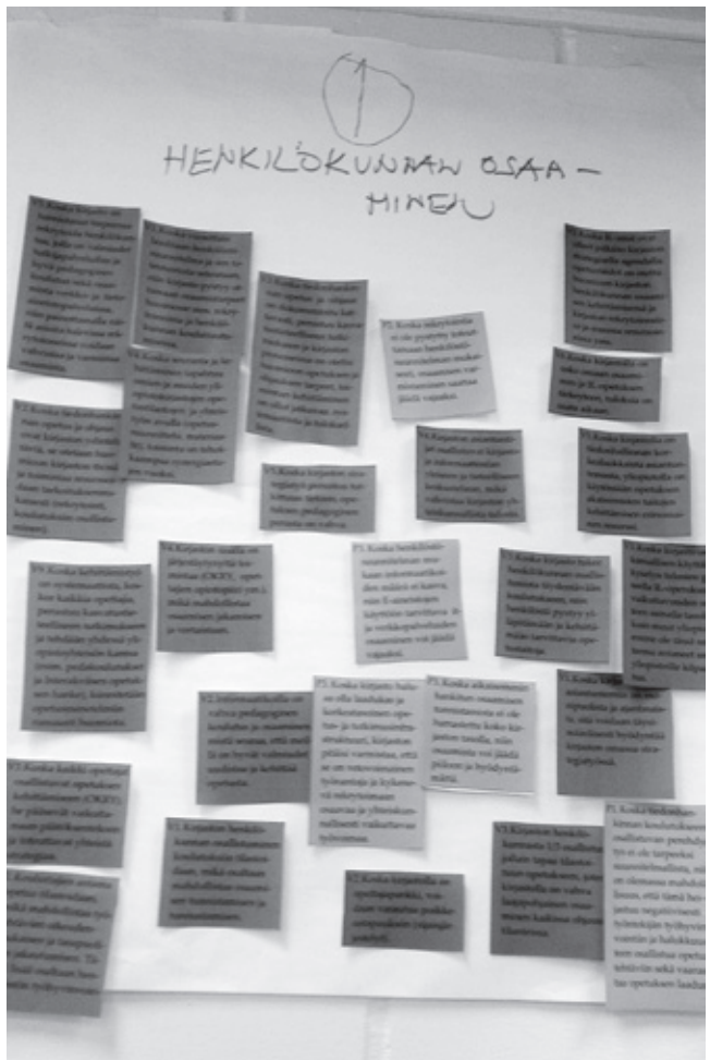
Itsearviointin kooste seinätauluna

Parantamisalueiden monimuotoisuuden vuoksi