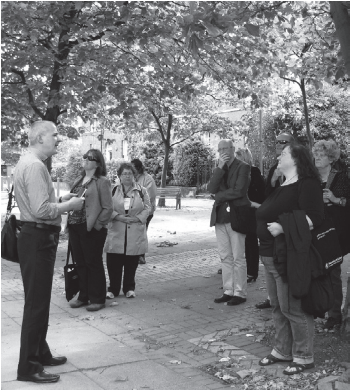
Kuva: Tiina Lehti Oinas