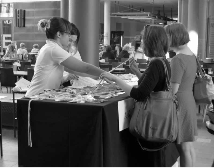
Kirjastopäivien ilmoittautuminen käynnissä.