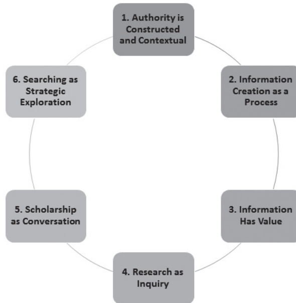
Kuva 1. Six Information Literacy Frames (Framework for Information Literacy for Higher Education)

“Metaliteracy prepares individuals to actively produce and share content in collaborative online environment” (Mackey ja Jacobson 2011, 64).