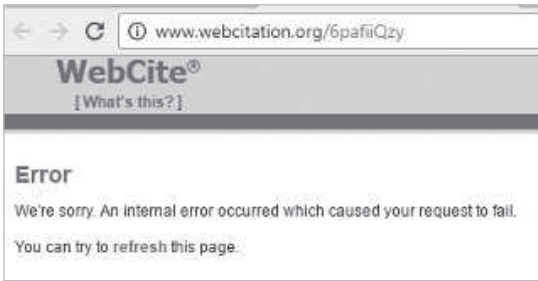
Kuvio 2. WebCite-palvelun virheilmoitus

käyttävä julkaisija on sitoutunut säilyttämään aineiston saatavilla verkkotunnuksista tai sivuston rakenteen muutoksista huolimatta. Oman kokemukseni mukaan tutkijoiden tiedot pysyvästi tunnisteista ovat rajallisia tietokannoissa käytössä olevia DOI-tunnisteita lukuun ottamatta, eikä niiden hyötyjä täysin tunnusteta lähteisiin viitattaessa.