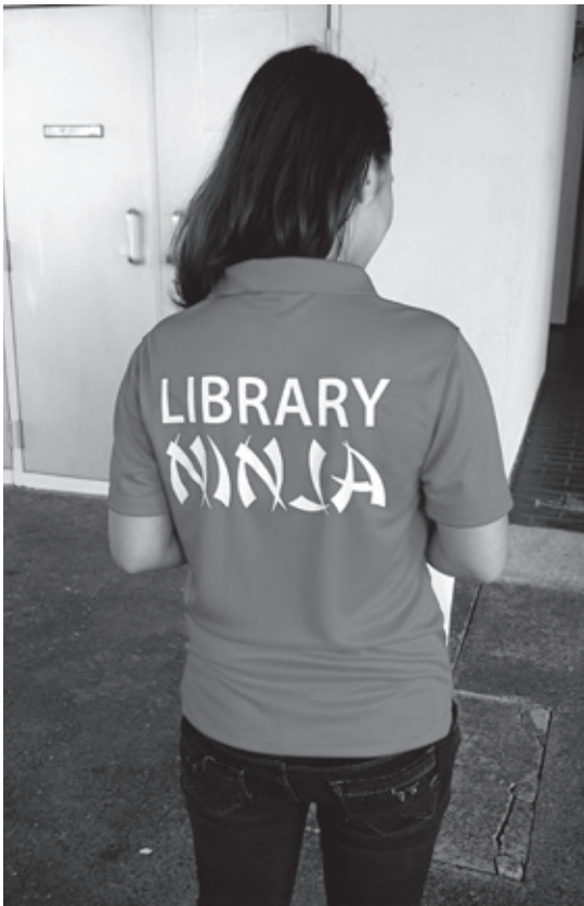
NTU:n kirjastossa palvelivat kirjastotätien lisäksi kirjastoninjat

teknologinen muutos ja sen aiheuttamat yhteiskunnalliset muutokset: häviääkö yleinen kirjastolaitos e-kirjojen tulon myötä, häviääkö teollisuus 3D-tulostuksen myötä, häviääkö painettu kirja ja lehti vai onko tulevaisuus monien rinnakkaisten medioiden ja teknologioiden suo, jossa yksittäisen ihmisen ja kirjaston on löydettävä oma polkunsaa?