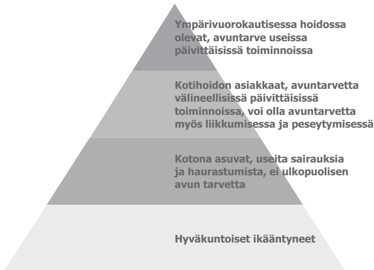
Ikääntyneiden ryhmät ja ravitsemuksessa huomioonotettavat asiat (Lähde: Ravitsemussuosituks- et ikääntyneille, 2010)