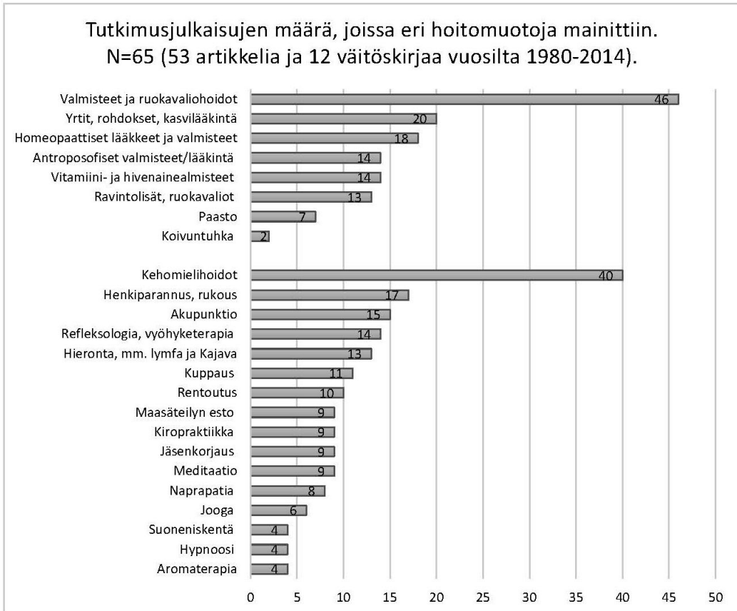
Kuvio 2. CAM-hoitoja käsittelevissä tutkimusjulkaisuissa vuosina 1980–2014 useammin kuin yhden kerran mainitut CAM-hoidot. Pääluokkien ”Valmisteet ja ruokavalioidot” ja ”Kehomielihoidot” alla olevat palkit kuvaavat julkaisujen määrää, joissa k.o. hoitomuoto on mainittu.

Huom.: Kuvion 2 hoitojen lisäksi vähintään yhdessä julkaisussa mainittiin joku tai joitakin seuraavista: avantouinti, Ayurveda, energiahoitot, heiluri, hydroterapia, kivi-, väri-, keskustelu- tai immunoterapia, käsilläparantaminen, koivunsiitepölyhunaja, mekaaninen hoito (lapamadon hoitotavat), porkkana, nikamakäsittely, rebalancing, reikihoito, tai chi, terapeuttinen kosketus ja rekabernaatio (asennetutkimusta varten keksitty käsite).