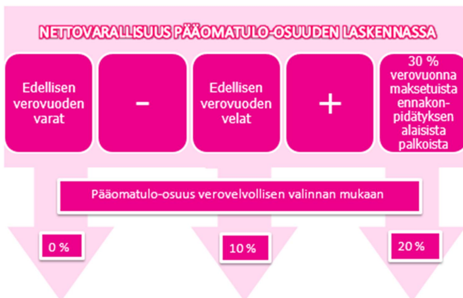
KUVIO 2. Pääomatulo-osuuden määrittäminen. (Savolainen 2015; Verohallinto 2015.)

hankalaa, tämän vuoksi jokaisen on kyettävä poimimaan omalle tilalle käyttökelpoiset keinot verotuksen suunnitteluun.